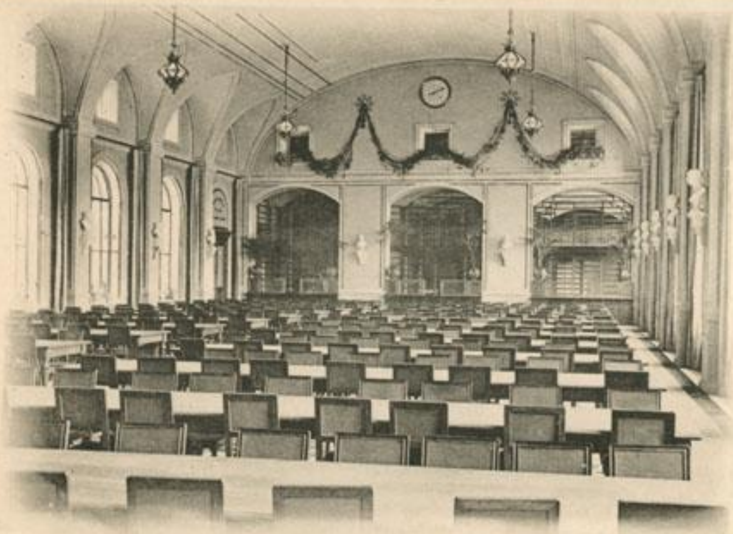
Внутренность Императорской Публичной Библиотеки въ С. Петербургѣ. L'Interieur de la Bibliothèque Impériale — St-Petersbourg