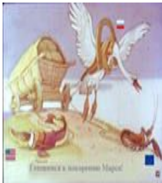
«Лебедь, рак и щука»