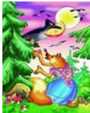
«Ворона и лисица»