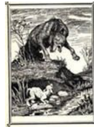
«Волк и ягненок»