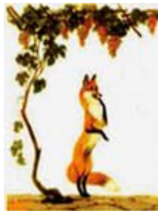
«Лисица и виноград»