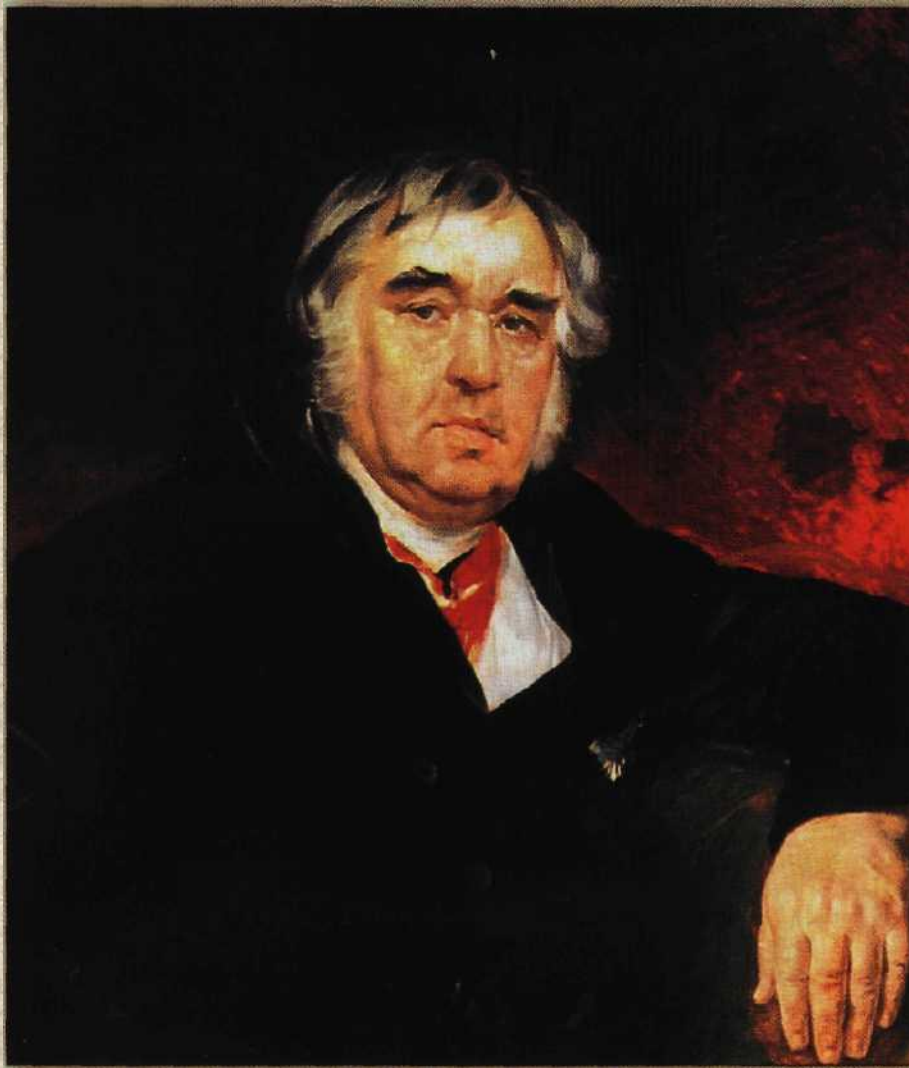
Иван Андреевич Крылов ( 1769-1844 )