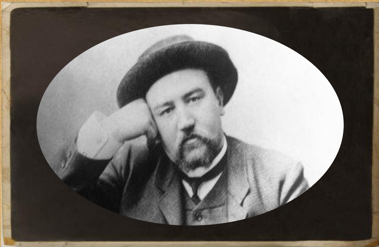
Куприн, Александр Иванович