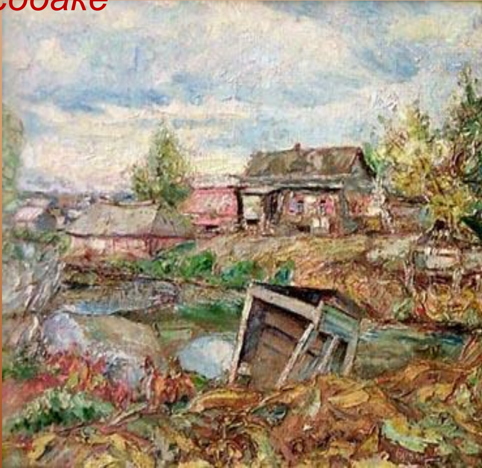
Художник Давид Бурлюк

...она никому не принадлежала у неё не было собственного имени