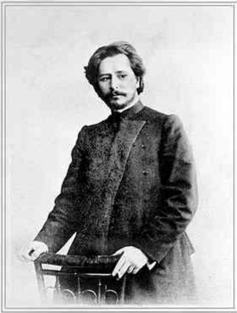
Л. Н. АНДРЕЕВЪ.