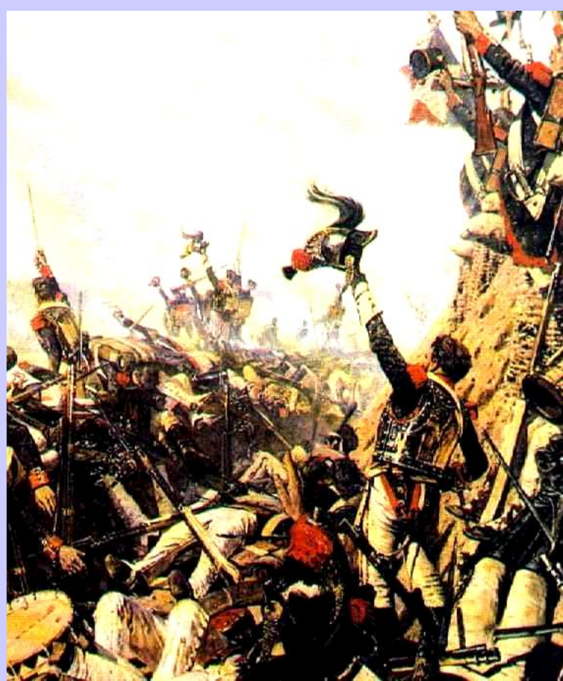
В.Верещагин.Конец Бородинского сражения

27 августа в 2 часа ночи Кутузов приказал отвести войска. Сражение не принесло победы ни одной из сторон. Французы потеряли 60 тыс. солдат, но за ними осталось поле боя. Русские-40 тыс, но они вынуждены были продолжить отступление.