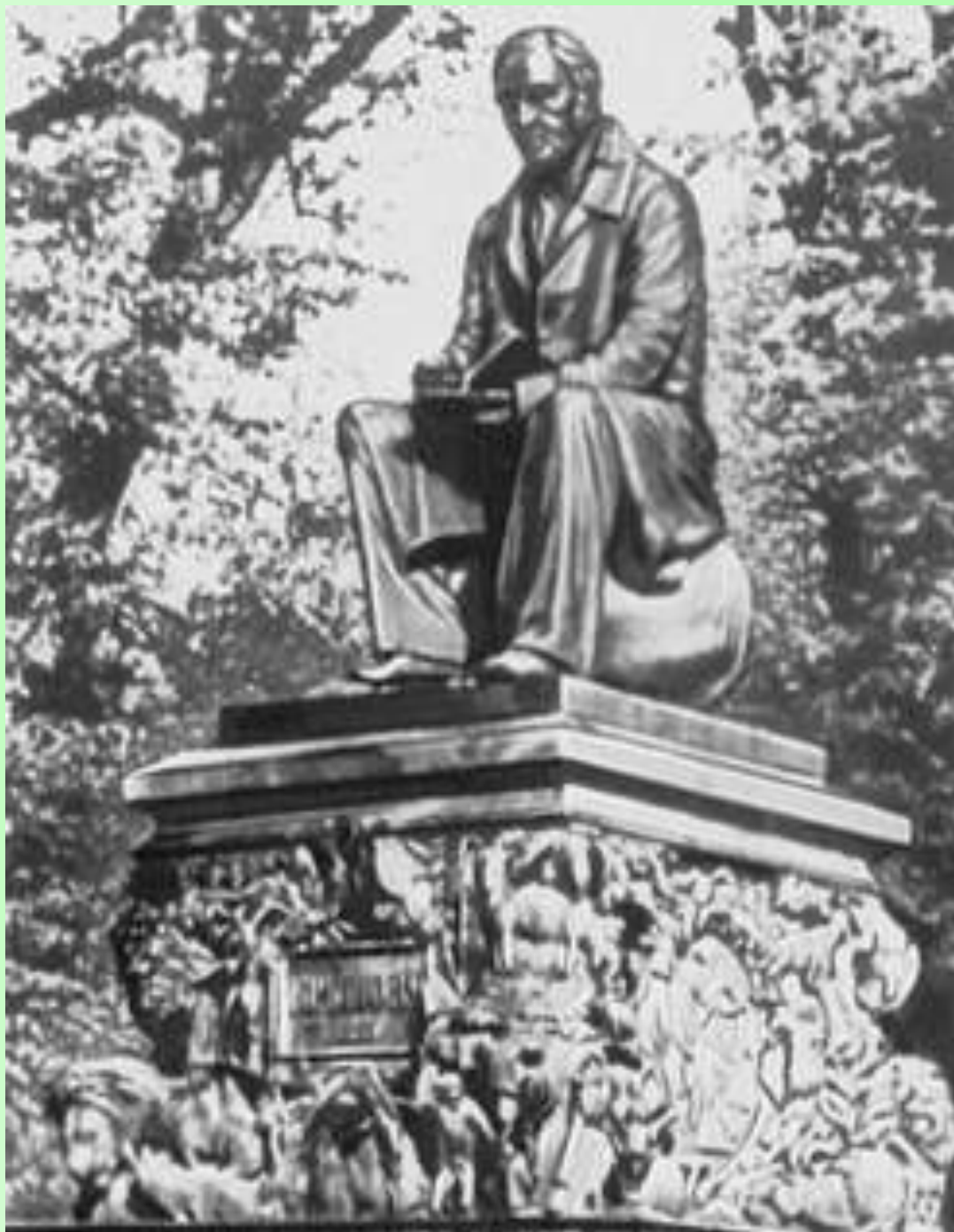
И.А.Крыловка тураскаал Ленинград (автору Клодт П.К.)