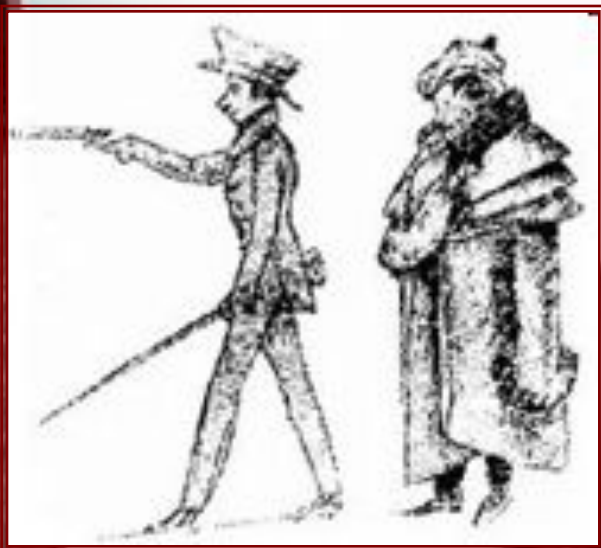
В.К.Кюхельбекер на Сенатской площади. Рисунок А.С.Пушкина

В Северное общество Кюхельбекера принял К.Ф. Рылеев накануне восстания 14 декабря, когда заговорщикам уже стало известно о смерти Александра I.