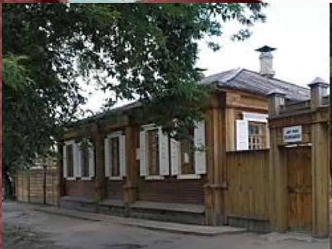
Дом В. Кюхельбекера в г. Курган