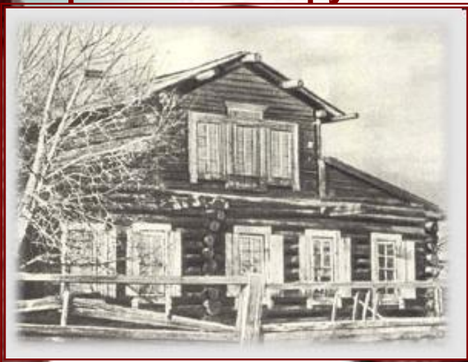
Дом В.К. Кюхельбекера в Баргузине. 1882 г.

После разгрома восстания ему удалось бежать из Петербурга, добраться до Варшавы, где его и арестовали жандармы. Потом был суд, десять лет одиночного тюремного заключения в разных крепостях, а с 1836 г. — сибирская ссылка. Сначала он отбывал её вместе со своим братом — декабристом Михаилом Кюхельбекером в Баргузине, потом в Акше Нерчинского округа.