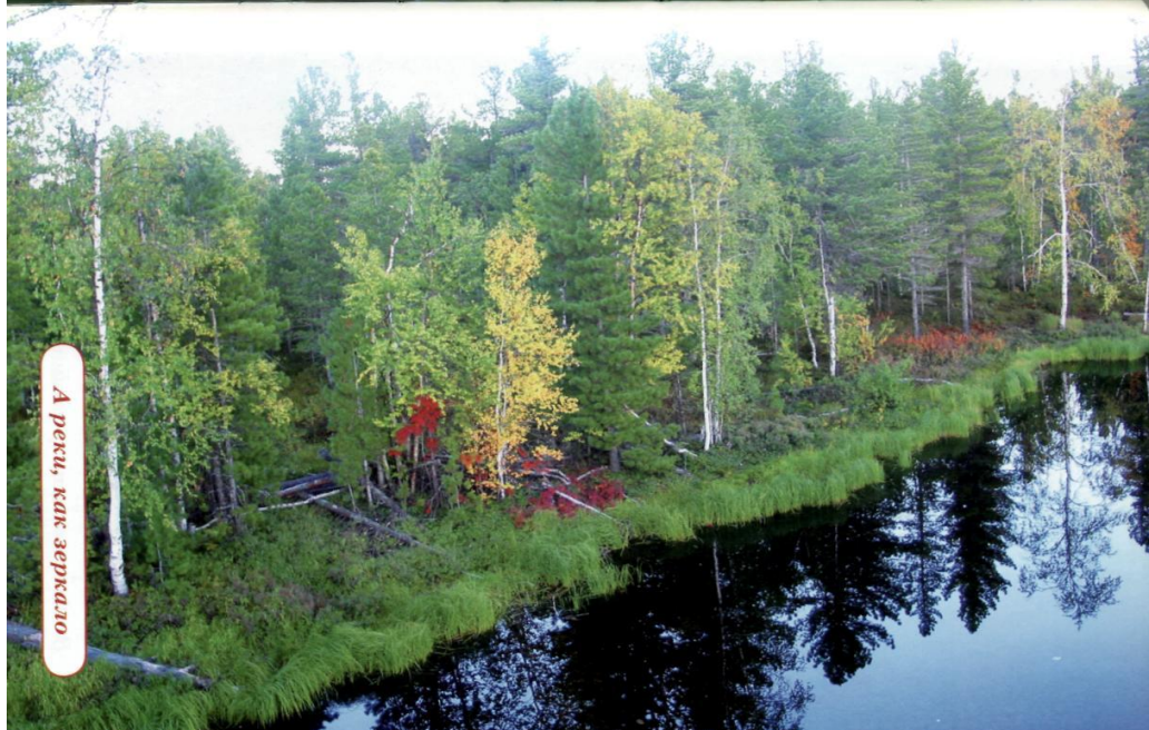
А реки, как зеркало

Рябина – эти плоды созревают к январю и служат питанием для птиц зимой.