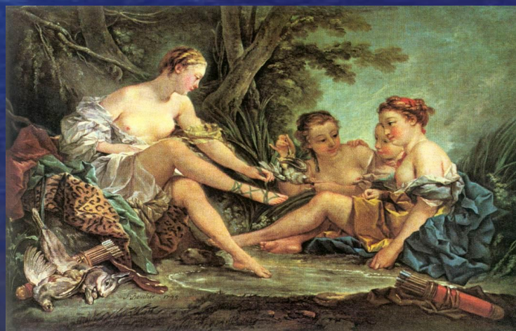
Франсуа Буше. Диана после охоты.