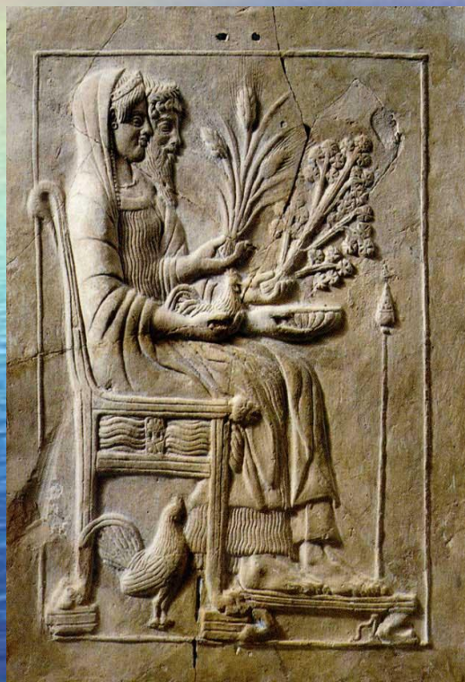
Бог подземного царства