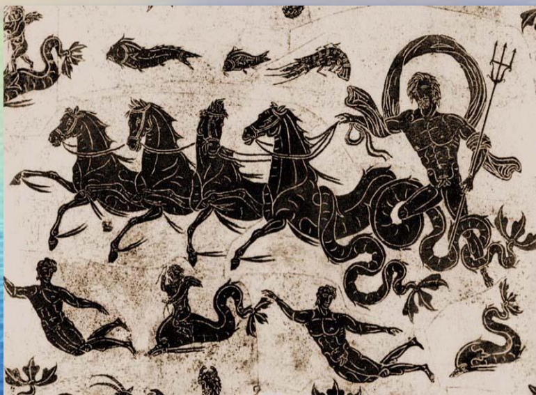
Бог морей, океанов