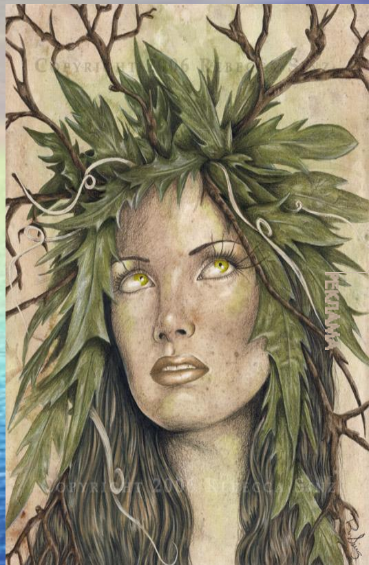
Гея, богиня Земли