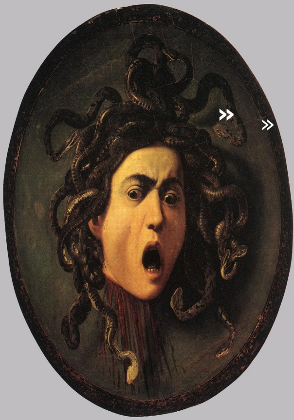
Микеланджело Мериси да Караваджо. Медуза.