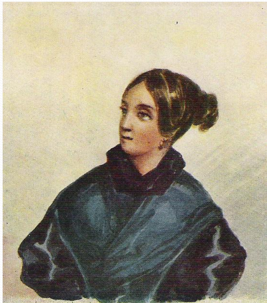
58. В. А. Лопухина. 1835—1838 гг.