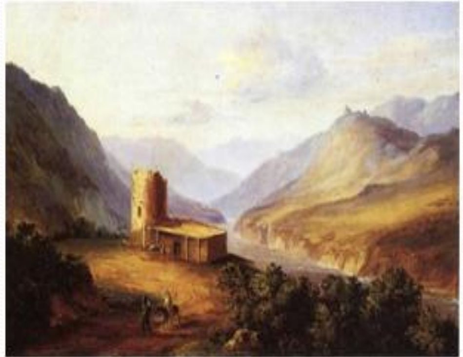
Военно-грузинская дорога близ Мцхета. (Кавказский вид с саклей), 1837