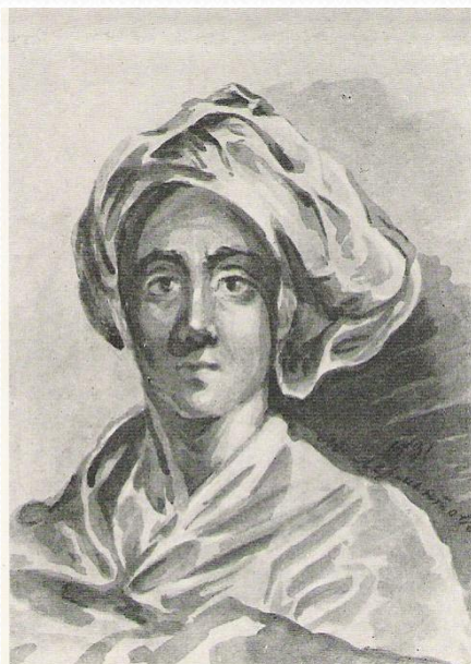
7. Юноша в бурнусе и восточном головном уборе. 1831 г.