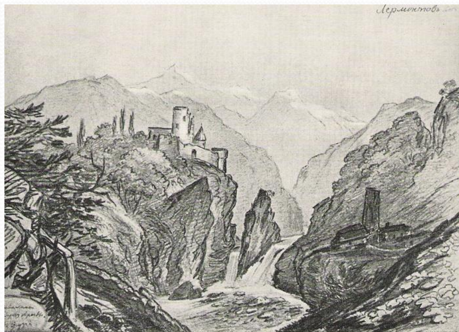
2. Развалины на берегу Арагвы. 1837 г.