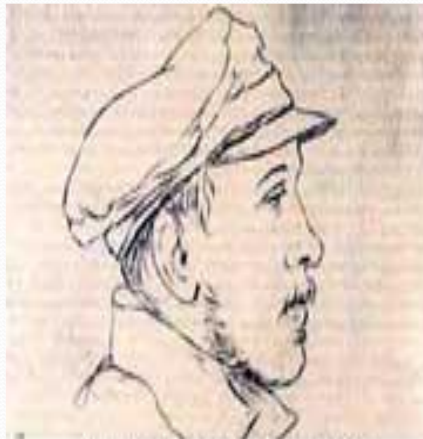
Рисунок Д.П. Палена 1840 г.