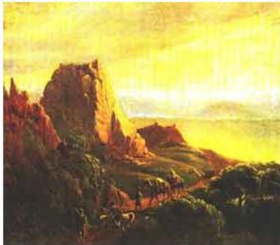
Развалины близ селения Караагач в Кахетии, 1837