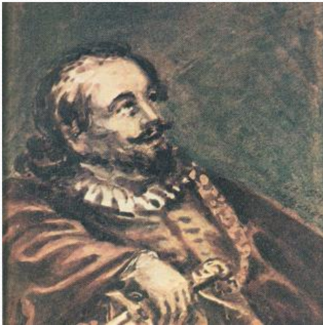
"Испанец с кинжалом", 1830