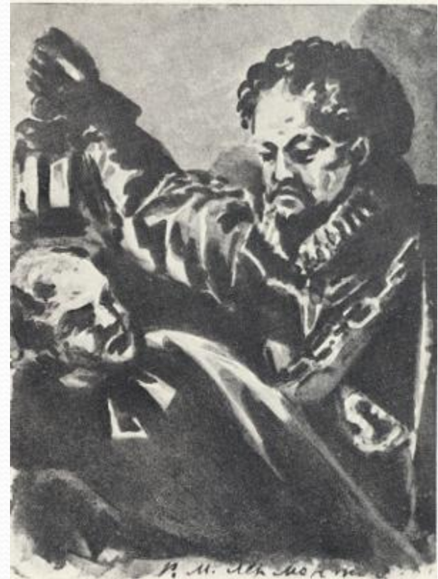
"Испанец с фонарем и католический монах", 1830