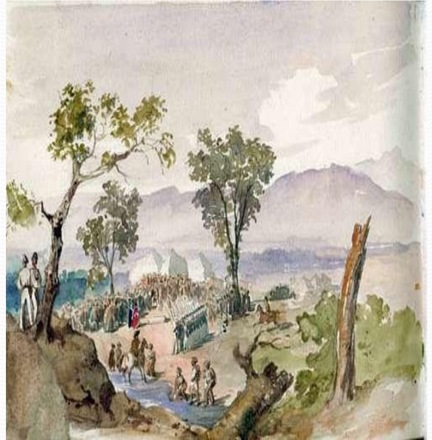
«Бой при Валерике» 1840-1841