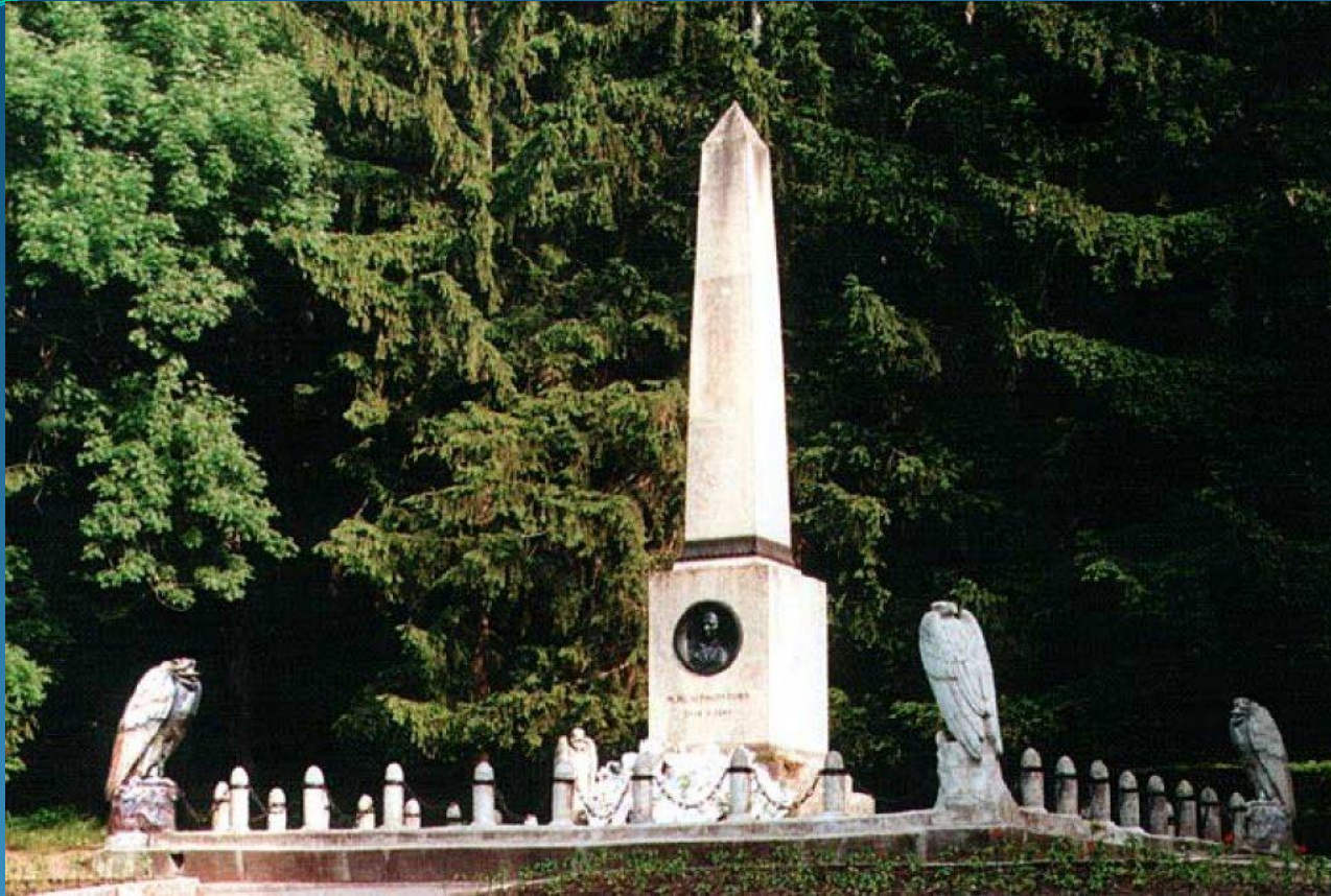
Памятник М.Ю.Лермонтову на месте дуэли в Пятигорске