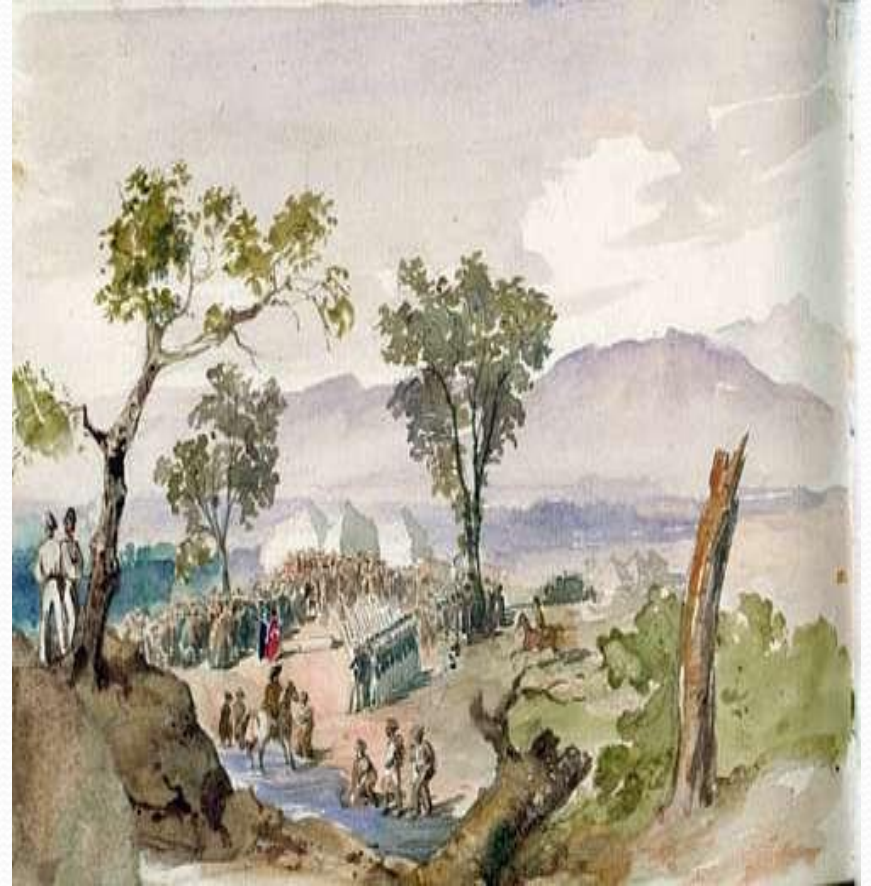
«Бой при Валерике» 1840-1841