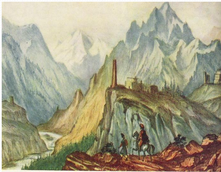
60. „Вид Крестовой горы из ущелья близ Коби“. 1837 г.