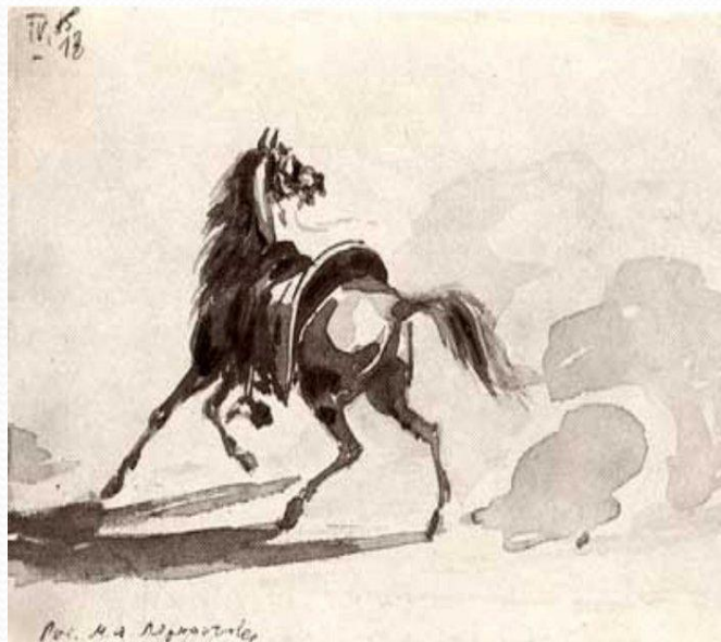
«Оседланная лошадь. Сепия» 1830-е гг.