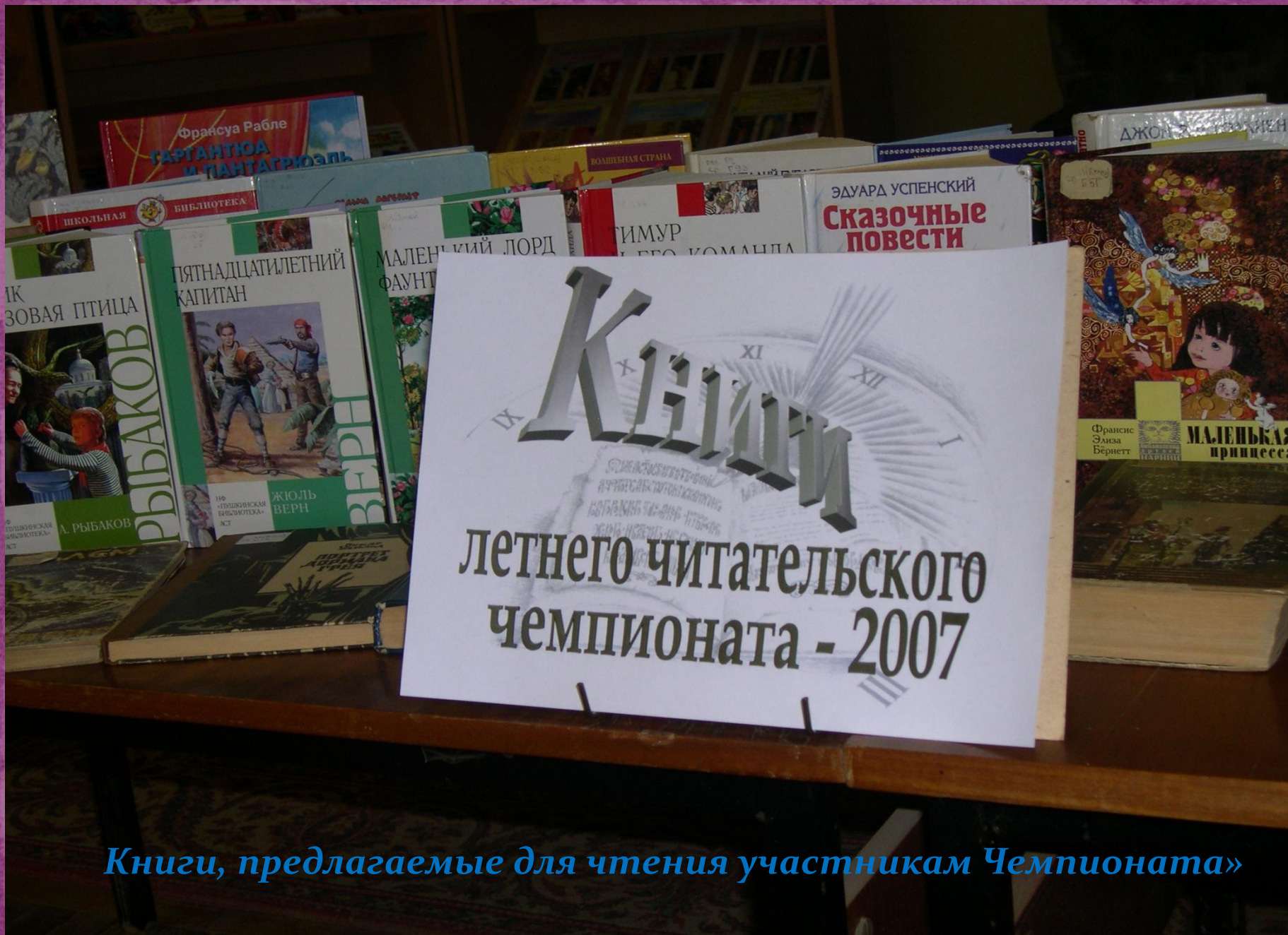
Книги, предлагаемые для чтения участникам Чемпионата»