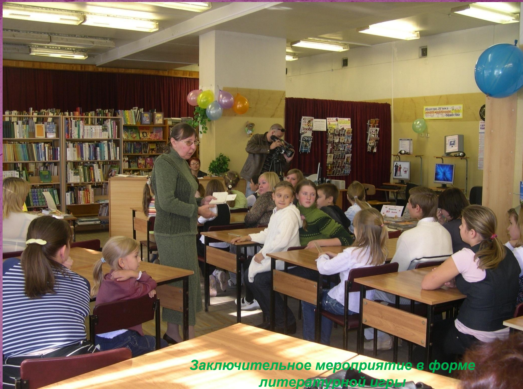
Заключительное мероприятие в форме литературной игры