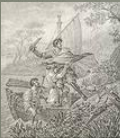
Сцена галицко-волынской летописи, изображающая сцену с лодкой, вероятно, из летописи 1114 года.

Она, как можно предположить, была писана сначала без годов, а годы расставлены после и расставлены весьма неискусно