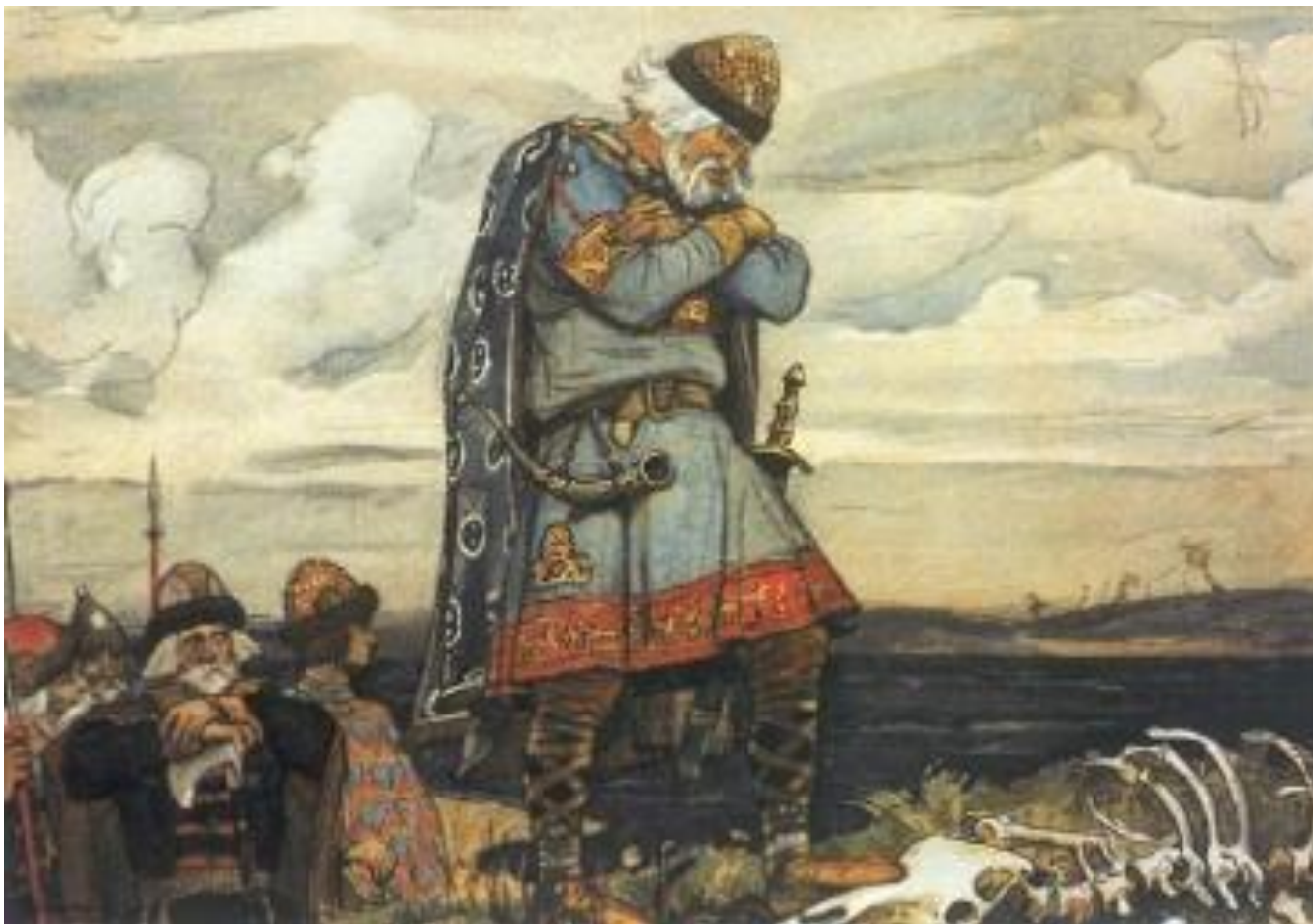
В. В. Васнецов. Олег у костей коня Иллюстрация к "Песни о вещем Олеге" А.С.Пушкина 1899г, акварель, Государственный Литературный музей, Москва