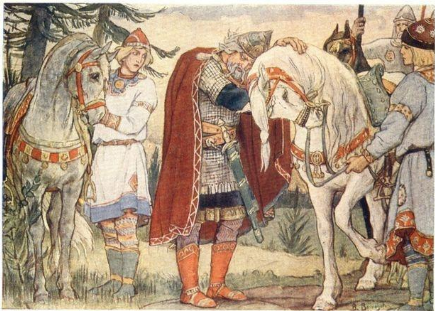
В. М. Васнецов. Прощание с конём Иллюстрация к "Песни о вестем Олеге" А.С.Пушкина 1899г,акварель, Государственный Литературный музей, Москва