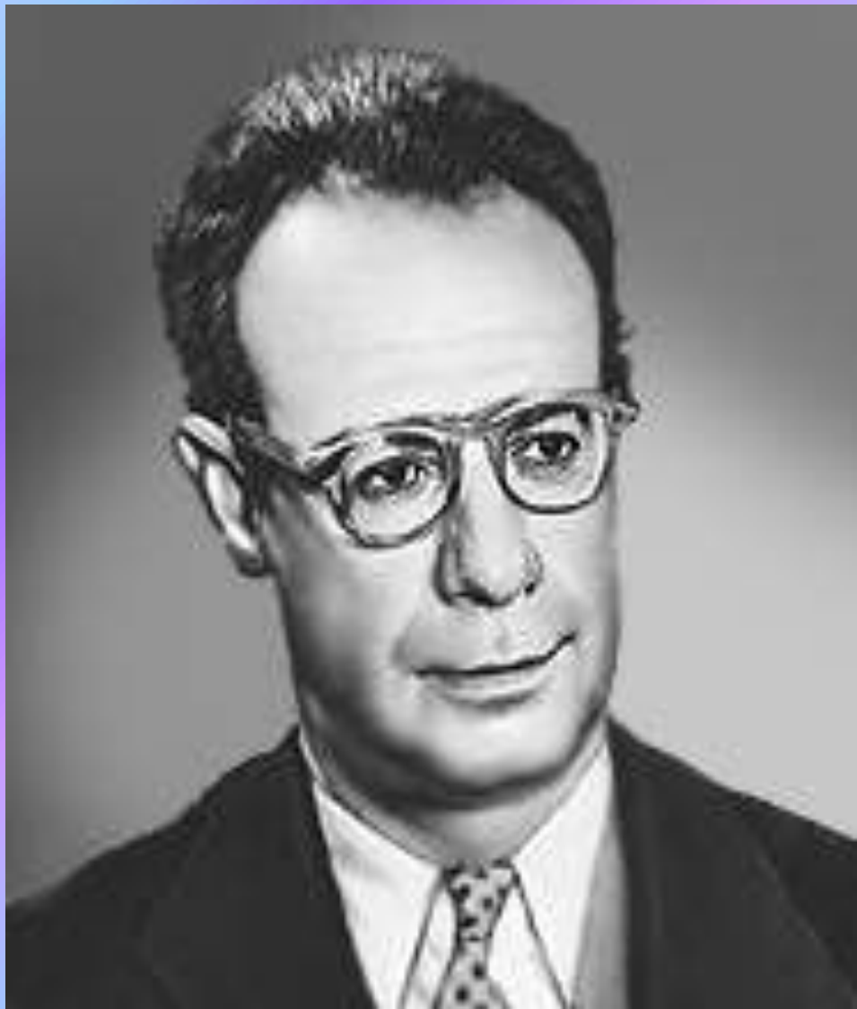
Лев Кассиль 1905 - 1970