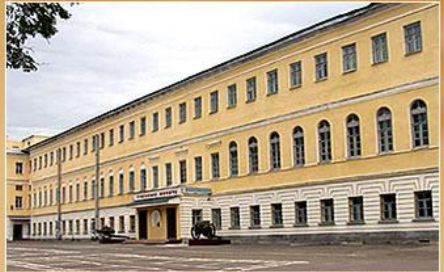
Казанское суворовское военное училище