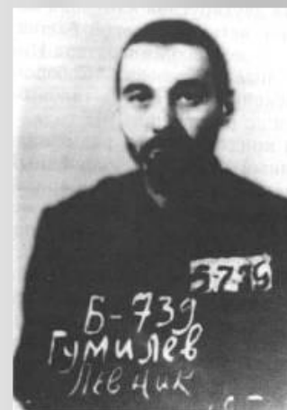
Из дела осужденного Гумилева Л.Н.