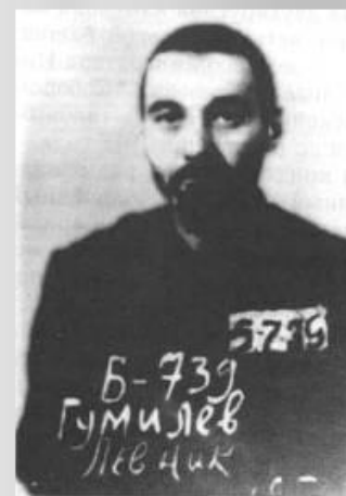
Из дела осужденного Гумилева Л.Н.