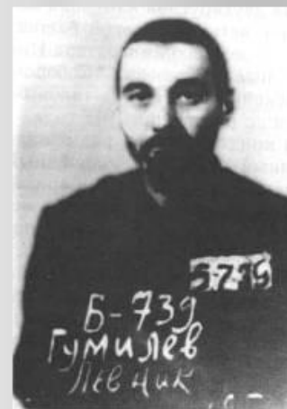
Из дела осужденного Гумилева Л.Н.