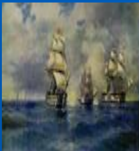
Бриг «Меркурий» ведёт бой с двумя турецкими кораблями.