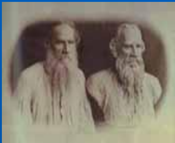
Л. Н. Толстой рядом со своим скульптурным портретом работы И.Е. Репина. 1891 г. Ясная Поляна.

Понять Толстого – это значит самому, хотя бы на какое-то время, попытаться войти в круг осмысления таких проблем, как человек и природа, жизнь – смерть – бессмертие; свобода и несвобода в судьбе человека и общества, долг и счастье, ступени жизни: от детства через “пограничную ситуацию” к воскресению; вера и сомнение; добро и зло, насилие – усилие – “непротивление злу насилием”, красота истинная и ложная, благо животное и духовное.