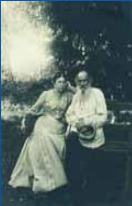
Л. Н. Толстой и С. А. Толстая.