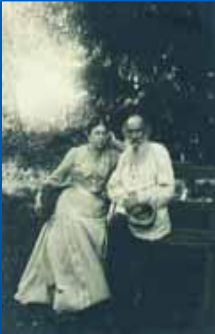
Л. Н. Толстой и С. А. Толстая.