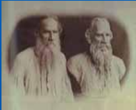
Л. Н. Толстой рядом со своим скульптурным портретом работы И.Е. Репина. 1891 г. Ясная Поляна.

Понять Толстого – это значит самому, хотя бы на какое-то время, попытаться войти в круг осмысления таких проблем, как человек и природа, жизнь – смерть – бессмертие; свобода и несвобода в судьбе человека и общества, долг и счастье, ступени жизни: от детства через “пограничную ситуацию” к воскресению; вера и сомнение; добро и зло, насилие – усилие – “непротивление злу насилием”, красота истинная и ложная, благо животное и духовное.