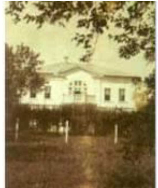
Открыл школу для бедных детей в Ясной Поляне