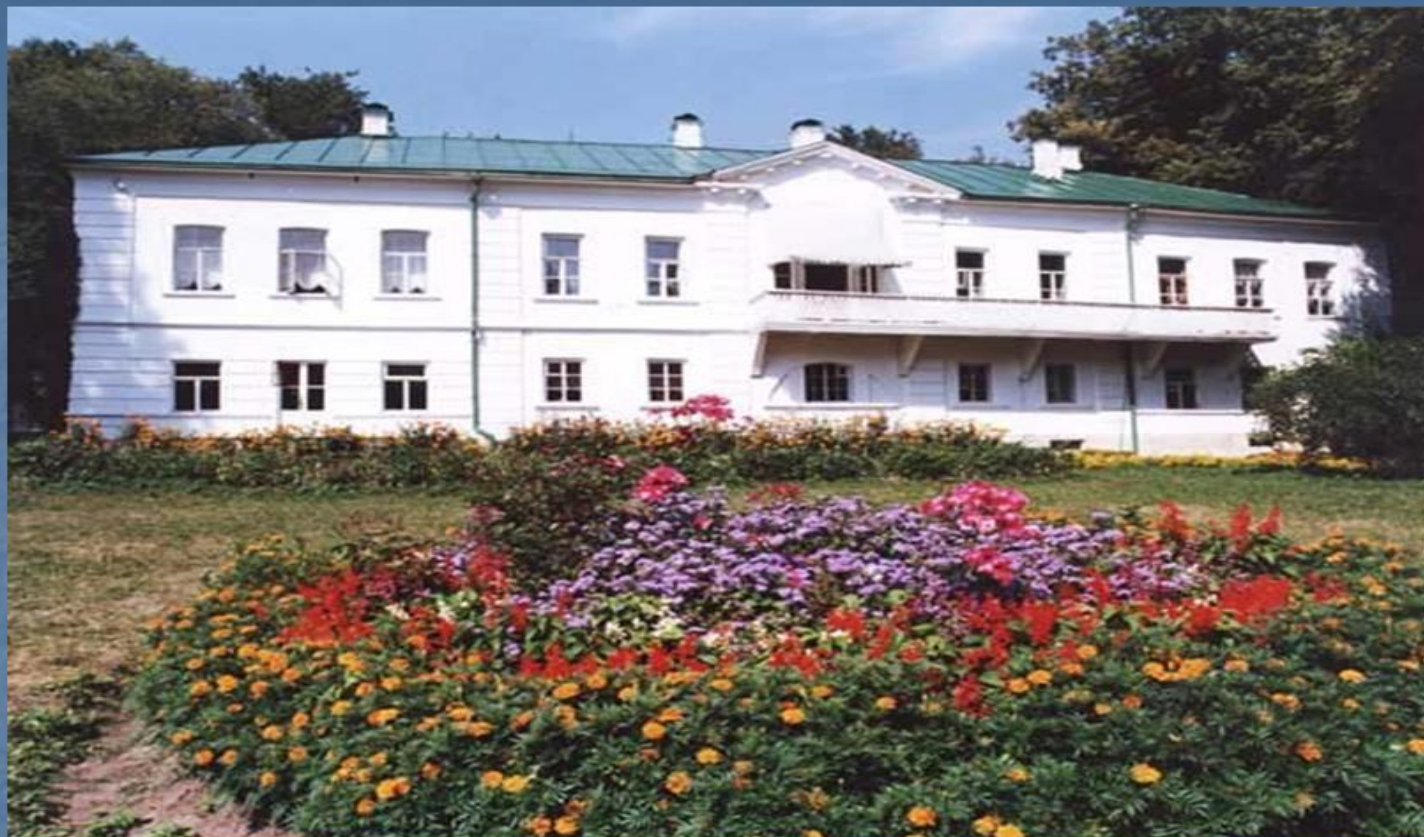
Дом-музей Толстого в Ясной Поляне

В Ясной Поляне Толстой прожил более шестидесяти лет