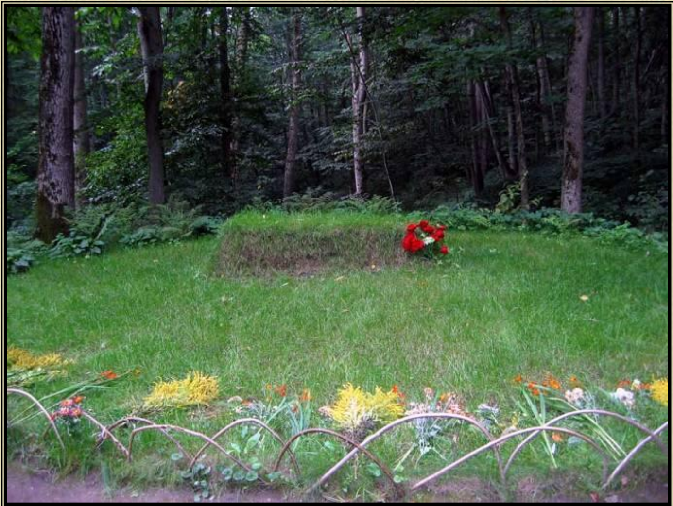
Могила Л. Н. Толстого