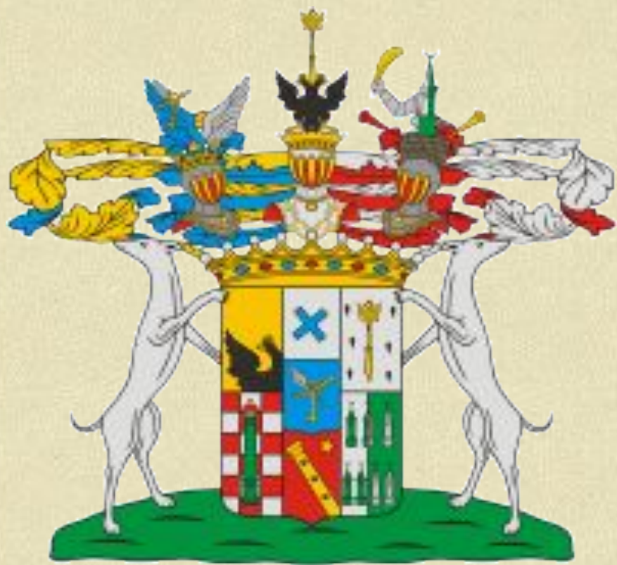
Герб рода графов Толстых