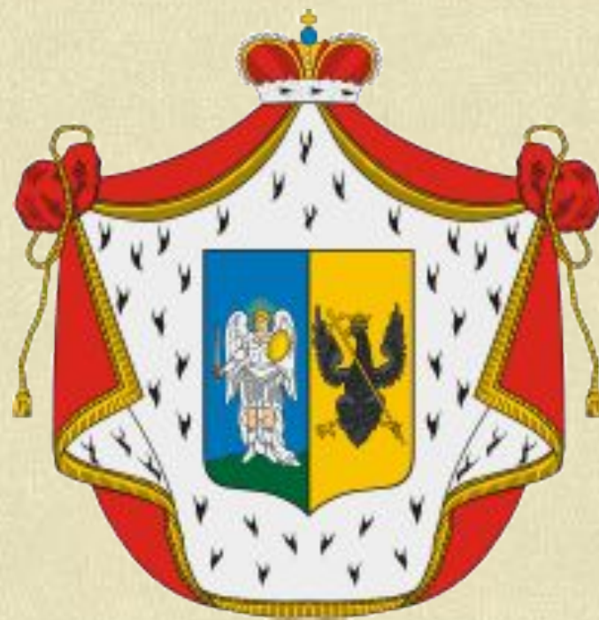
Герб рода князей Волконских