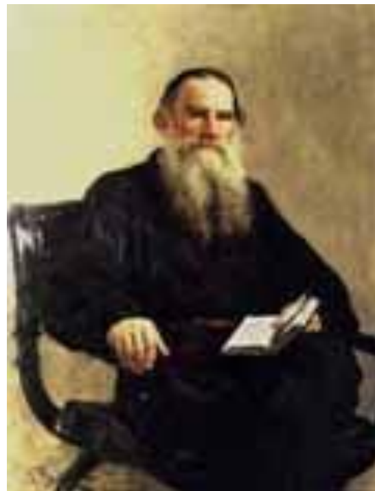
Портрет: Л. Н. Толстой. Художник И. Репин