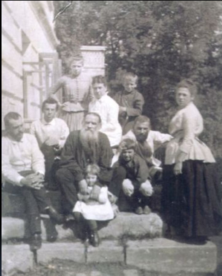
Л. Н. Толстой с женой и детьми. 1887 год