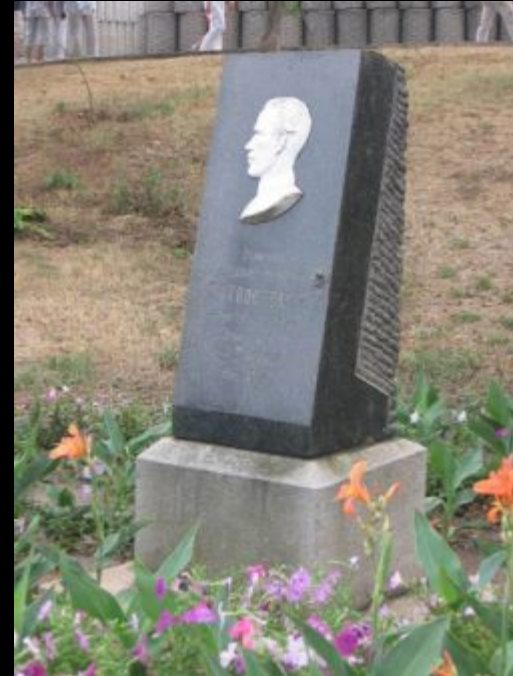
Стела в память участника обороны Севастополя 1854—1855 гг. Л. Н. Толстого у четвёртого бастиона

Впечатления писателя от Кавказской войны отразились в рассказах "Набег" (1853), "Рубка леса" (1855), "Разжалованный" (1856), в повести "Казачи" (1852—1863).