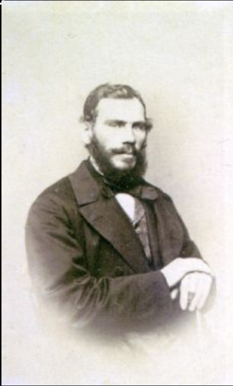
Л. Н. Толстой, 1862 г.

В 1862 г. он женился на дочери московского врача Софье Андреевне Берс