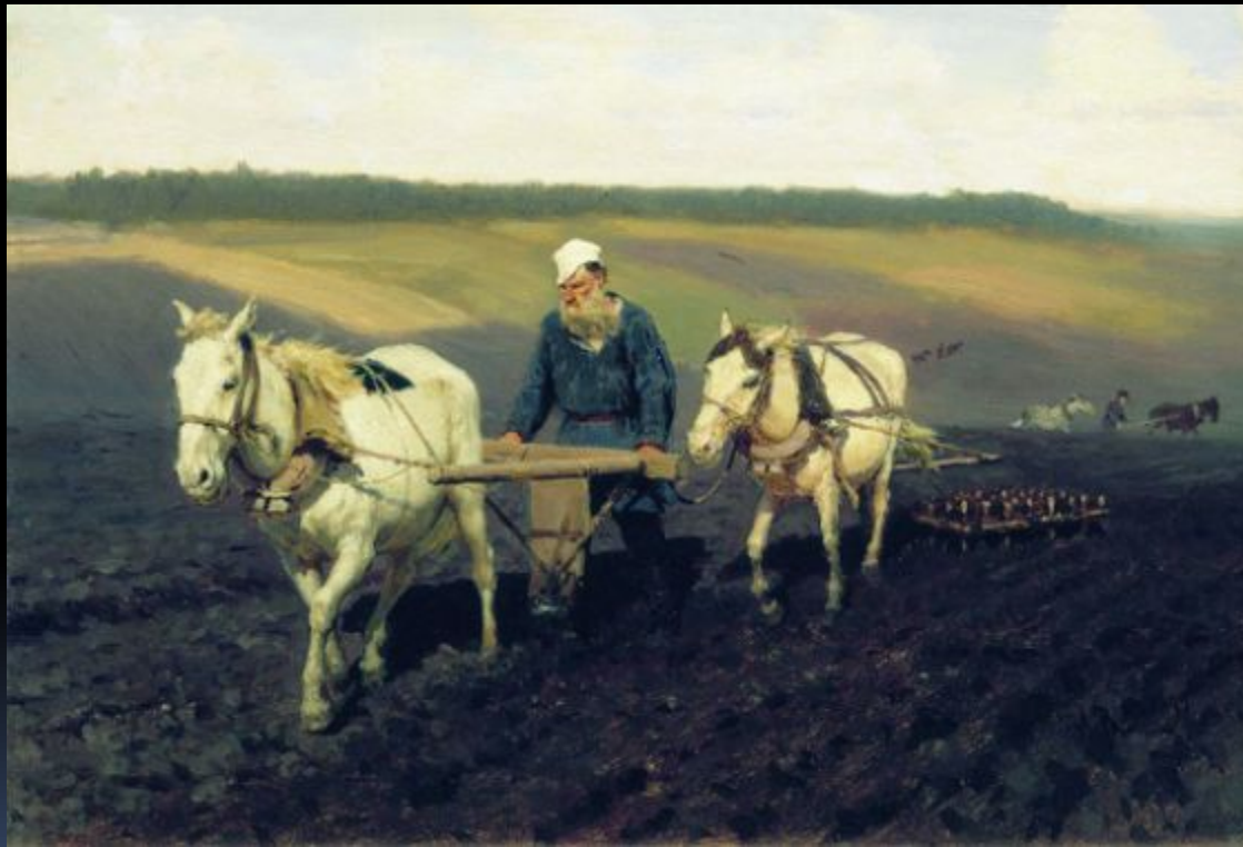
Пахарь. Лев Николаевич Толстой на пашне. 1887. Е. И. Репин.

В 80-е гг. Толстой заметно охладевает к художественной работе и даже осуждает как барскую "забаву" свои прежние романы и повести. Он увлекается простым физическим трудом, пашет, шьет себе сапоги, становится вегетарианцем, отдает семье все свое крупное состояние, отказывается от прав литературной собственности.