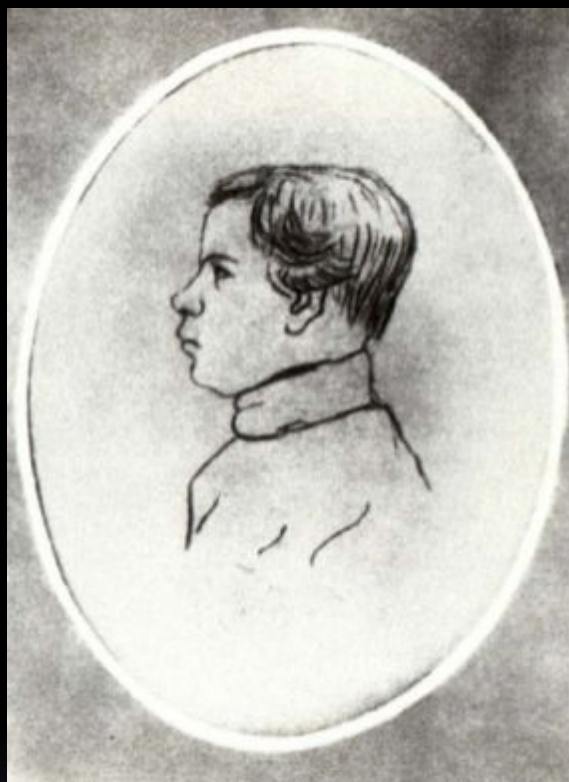
Толстой Л. Н. (юношей, в профиль)

Когда Толстому шел девятый год, отец впервые повез его в Москву. Первый период московской жизни юного Толстого продолжался менее четырех лет. Но вскоре отец умер. В 1840 году с сестрой и тремя братьями юный Толстой переезжает в Казань. Здесь жила одна из отцовских сестер, ставшая их опекуной.