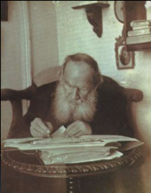
Л.Н. Толстой за работой в кабинете яснополянского дома.

Софья Андреевна оказалась не только вернейшим и преданнейшим другом, но и незаменимой помощницей во всех делах. По семь раз она переписывала без конца им переделываемые записи.