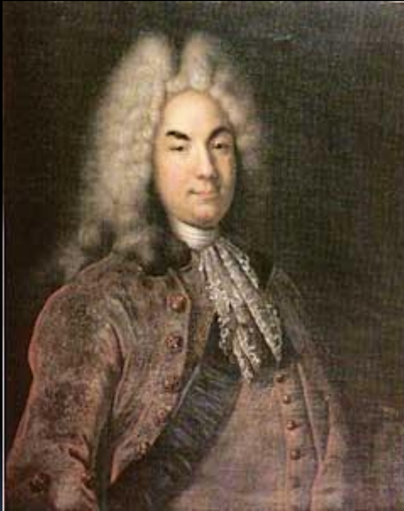
Портрет графа Петра Андреевича Толстого.

Среди предков писателя по отцовской линии был Пётр Андреевич Толстой (1645-1729) - сподвижник Петра I, русский государственный деятель, дипломат, одним из первых в России получивший графский титул.