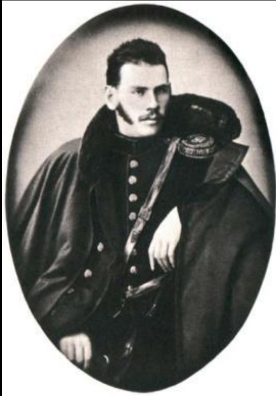
Л. Н. Толстой