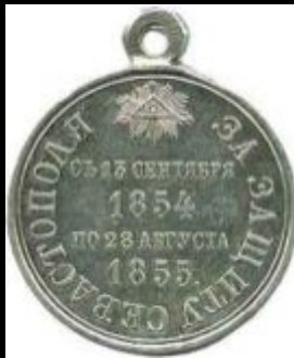
Медаль за защиту