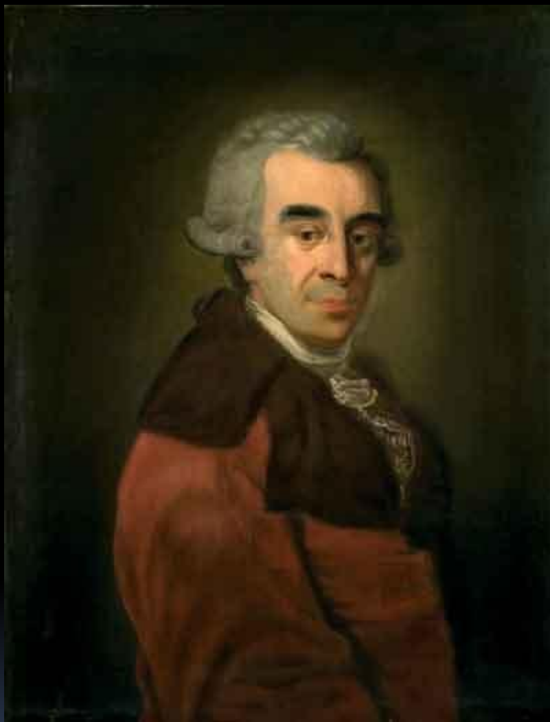
Князь Николай Сергеевич Волконский.

Князь Николай Сергеевич Волконский - видный военный деятель Екатерининской эпохи (дед Льва Николаевича Толстого по материнской линии)