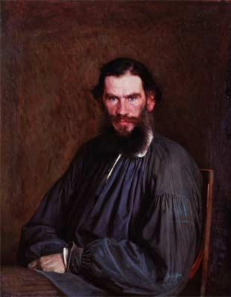
Лев Николаевич Толстой

Толстой Лев Николаевич (1828-1910), граф, русский писатель, член-корреспондент (1873), почетный академик (1900) Петербургской АН.