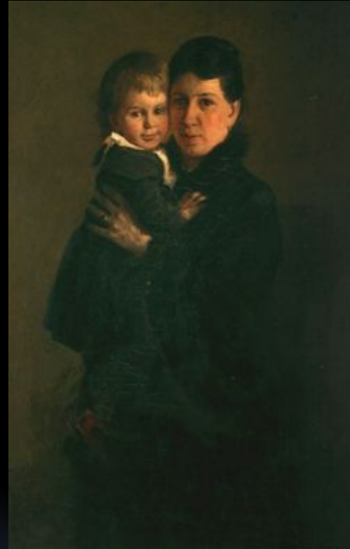
Ге. Портрет Софьи Андреевны Толстой с дочерью Александрой (Софья Андреевна Толстая, жена Льва Николаевича Толстого, 1844-1919; Александра Львовна Толстая, дочь Льва Николаевича Толстого, 1884-1979)