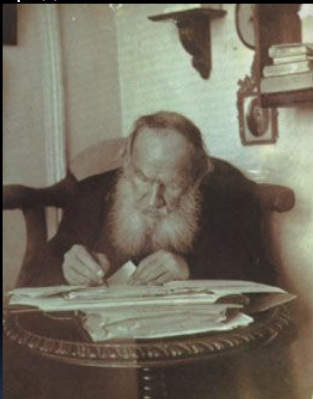
Л.Н. Толстой за работой в кабинете яснополянского дома.

Софья Андреевна оказалась не только вернейшим и преданнейшим другом, но и незаменимой помощницей во всех делах. По семь раз она переписывала без конца им переделываемые записи.