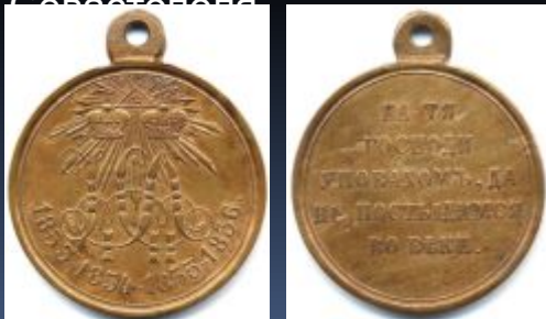
Медаль в память войны 1853 – 1856 г.

Вскоре Толстой решил поехать на Кавказ, где его старший брат, Николай Николаевич, офицер-артиллерист, служил в действующей армии. Поступив в армию юнкером, позже он сдал экзамен на младший офицерский чин. Когда началась Крымская война, Толстой перевелся с Кавказа в Дунайскую армию, действовавшую против турок, а затем в Севастополь, осажденный объединенными силами Англии, Франции и Турции.