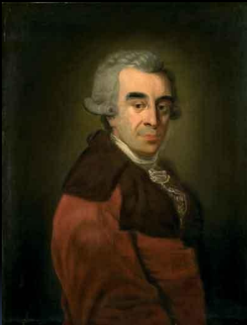
Князь Николай Сергеевич Волконский.

Князь Николай Сергеевич Волконский - видный военный деятель Екатерининской эпохи (дед Льва Николаевича Толстого по материнской линии)