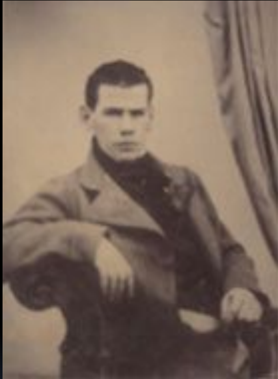
Л. Н. Толстой. 1849 г.

Он изучал историю и музыку, рисование и медицину, юридические науки и сельское хозяйство. И всю жизнь Толстой пополнял свои знания. (В зрелую пору жизни Толстой свободно владел английским, французским и немецким языками; читал на итальянском, польском, чешском и сербском; знал греческий, латинский, украинский, татарский, церковнославянский; изучал древнееврейский, турецкий, голландский, болгарский и другие языки).