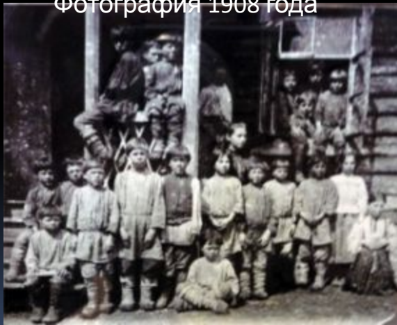
Ученики Льва Толстого

В 1859 г. Толстой открыл в Ясной Поляне школу для крестьянских детей, а затем помог открыть более 20 школ в окрестных деревнях.