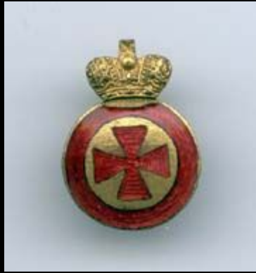
Орден св. Анны IV степени