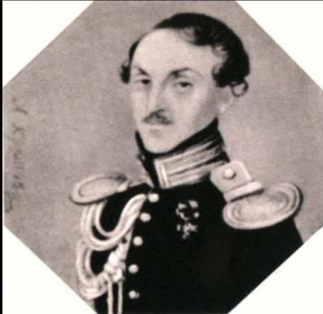
Николай Ильич Толстой, отец Льва Николаевича

Отец писателя – граф Николай Ильич Толстой – в семнадцатилетнем возрасте добровольно поступил на военную службу. Он участвовал в Отечественной войне 1812 года, попал в плен к французам и был освобожден русскими войсками, вступившими в Париж после разгрома армии Наполеона.