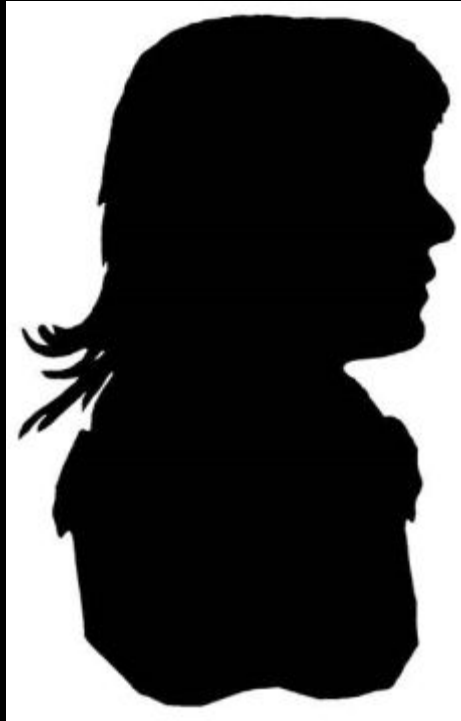
Силуэт княжны Марии Николаевны Волконской.

Мария Николаевна Толстая (урождённая Волконская), мать писателя, была добрым и отзывчивым человеком, умной и образованной женщиной: знала французский, немецкий, английский и итальянский языки, играла на фортепиано, занималась живописью. Толстому не исполнилось и двух лет, когда она умерла. В семье не сохранилось ни одного ее портрета, кроме маленького силуэта, где Мария Николаевна изображена восьмилетней девочкой.