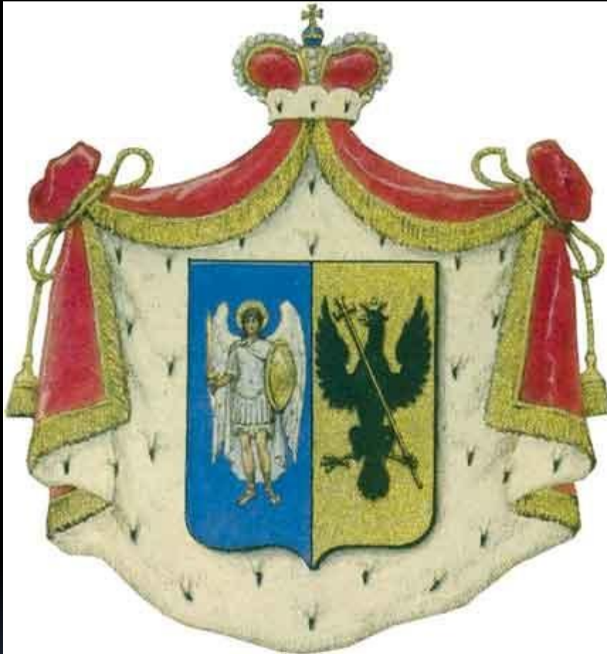
Герб князей Волконских.

По материнской линии Толстой принадлежал к роду князей Болконских, связанных родством с князьями Трубецкими, Голицыными, Одоевскими, Лыковыми и другими знатными семьями. По матери Толстой был родственником