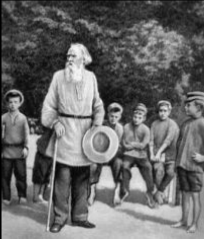
Л. Н. Толстой с детьми крестьян Ясной Поляны. Фотография 1908 года