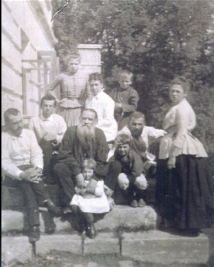
Л. Н. Толстой с женой и детьми. 1887 год

«Нельзя передать с достаточной полнотой того веселого и привлекательного настроения, которое постоянно царило в Ясной Поляне (1862-1878гг.). Источником его всегда был Лев Николаевич. В разговоре об отвлеченных вопросах, о воспитании детей, о внешних событиях его суждение было самое интересное. В игре в крокет, в прогулке он оживлял всех своим юмором и участием, искренне интересуясь игрой и прогулкой. Не было такой простой мысли и самого простого действия, которым Лев Николаевич не умел придать интереса и вызвать к ним хорошего и веселого отношения в окружающих...», - вспоминала Берс.