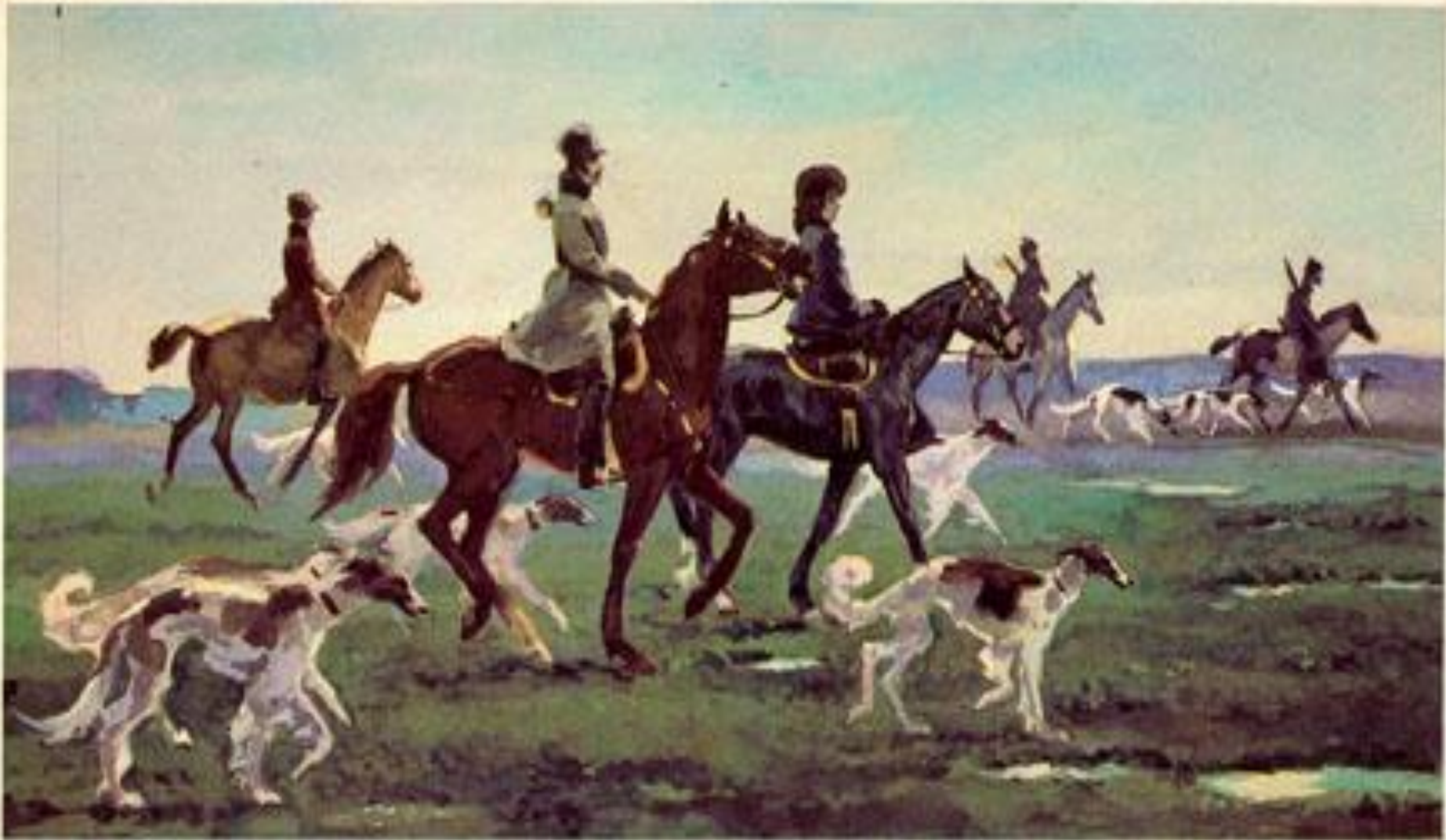
Эпизод охоты (2 том, 4 часть, 3-7 главы)