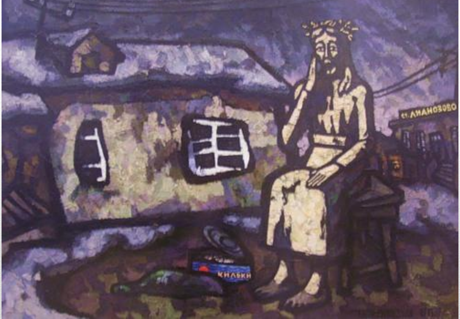
О.Рабин. «Пермский Христос в Лианозово»