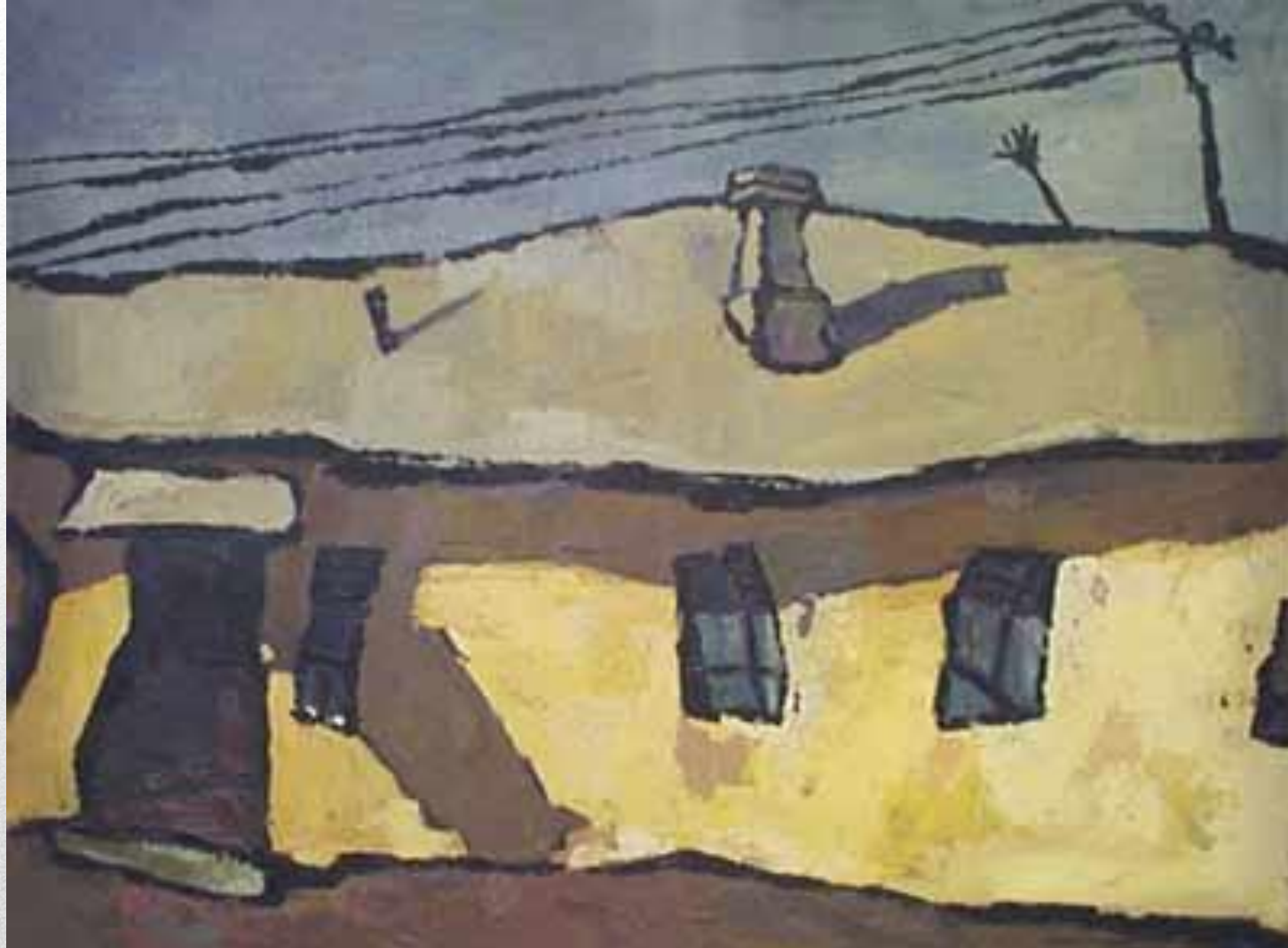
Оскар Рабин, "Оптимистический пейзаж", 1959