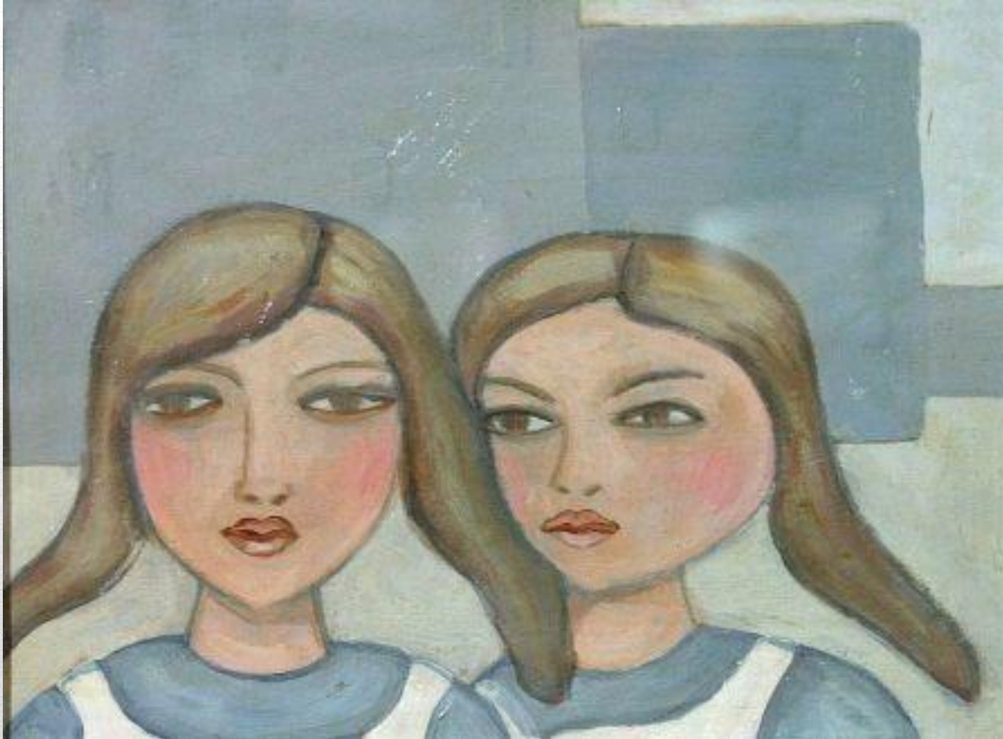
Е. Кропивницкий. «Двойной портрет школьниц»