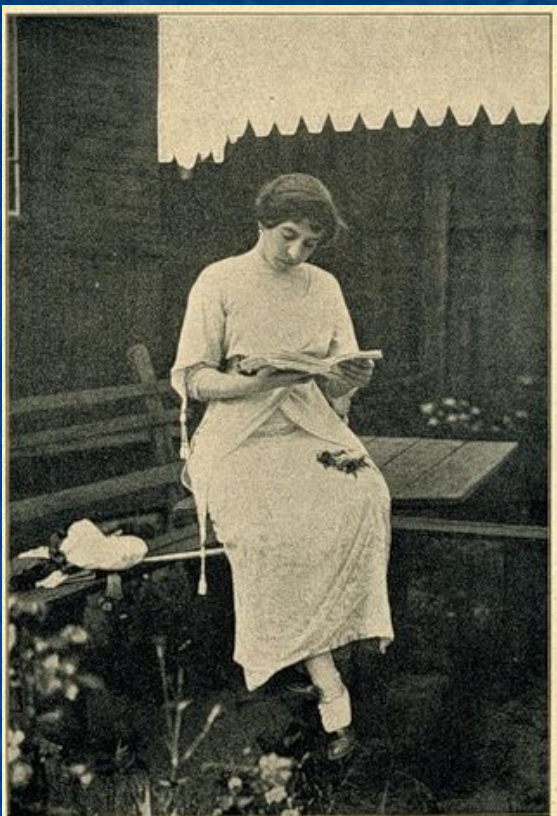
Л. А. Чарская у себя на дачѣ въ Сестрорѣцкѣ за чтеніемъ.

«Как хорошо сознавать, что ты можешь делать добро людям. Это лучшая радость королей , это счастье выпало мне.»