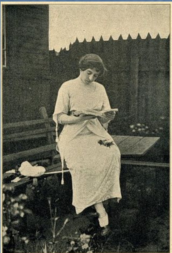
Л. А. Чарская у себя на дачѣ въ Сестрорѣцкѣ за чтеніемъ.

«Как хорошо сознавать, что ты можешь делать добро людям. Это лучшая радость королей , это счастье выпало мне.»