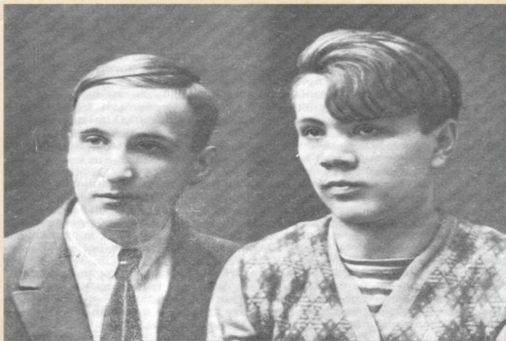
Г.Г. Бelyх и А.И. Пантелеев, 1928.

Л. Пантелеев (настоящее имя — Алексей Иванович Еремеев 9 (22 августа) 1908, Санкт-Петербург — 9 июля 1987, Ленинград ) — русский советский писатель. После революции, в годы гражданской войны, был беспризорником. После школы жил в Ленинграде и работал журналистом. Умер писатель 9 июля 1987 года в Ленинграде, похоронен на Большеохтинском кладбище .