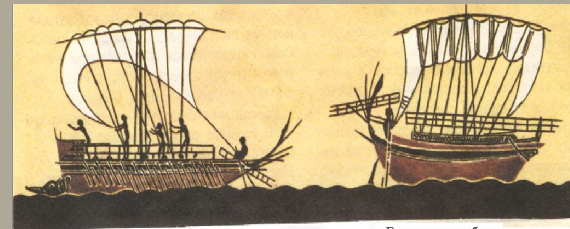
Греческие корабли. (Рисунки на вазах VI века до н. э.)