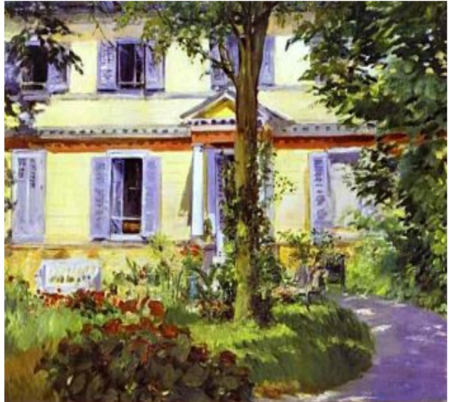
Мане Эдуард. "Дом в Руели", 1882 г.