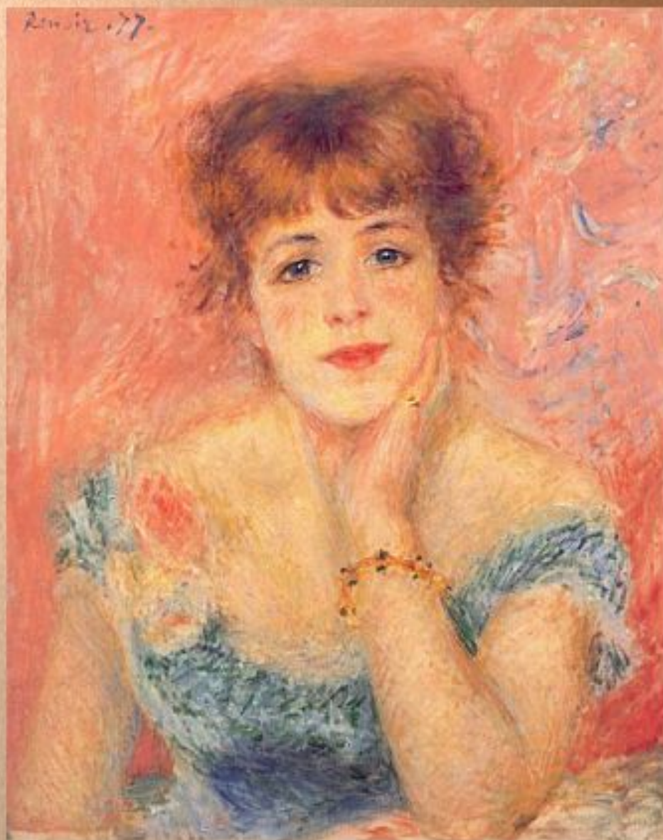
Ренуар Пьер Огюст. "Портрет актрисы Жанны Самари". 1877