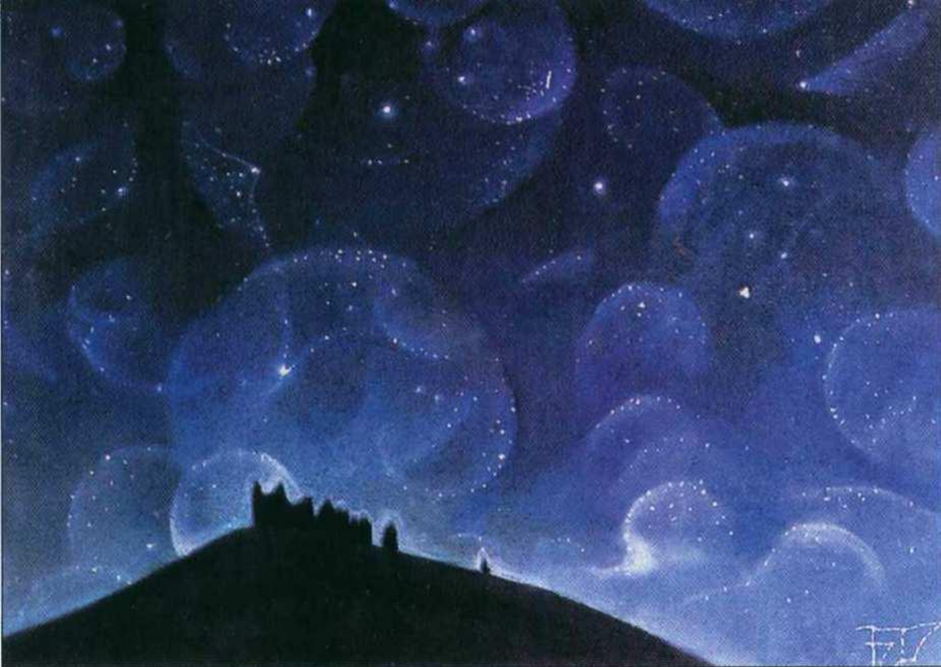
Б.Смирнов-Русецкий. Звездный сад. 1991