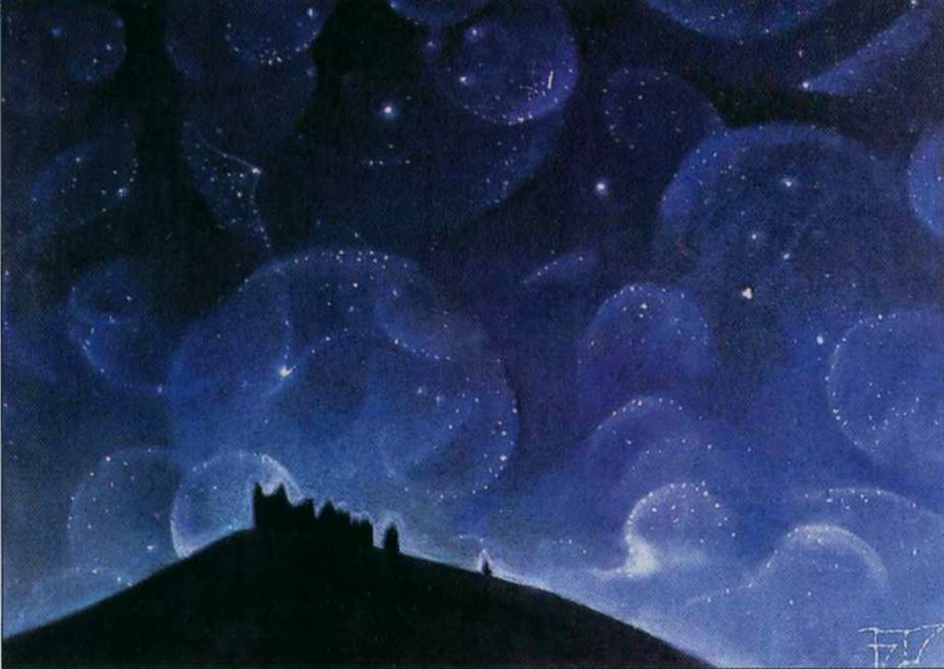
Б.Смирнов-Русецкий. Звездный сад. 1991