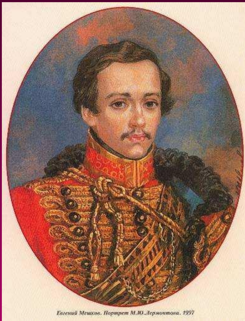
Евгений Мещков. Портрет М.Ю. Лермонтова. 1997

Михаил Юрьевич Лермонтов – русский поэт.