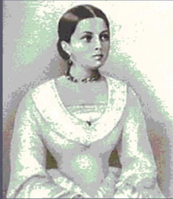
А. Я. Панаева

Драматичной была любовь поэта, связавшая его на долгие годы с Авдотьей Яковлевной Панаевой. Она была его счастьем и мукой, вызвала целую серию любовных стихотворений, известных под названием панаевского цикла. Влюблённые встречаются, ссорятся, мирятся, расстаются. И в этом «романе» утверждается идеал заботливой, ласковой женщины-подруги как опоры в трудной жизненной борьбе, как целительницы поэта, испытывающего творческие и сердечные муки. Стихотворение «Мы с тобой бестолковые люди..» посвящено Панаевой. Любовь в стихах Некрасова согревает человека, помогает выжить в жестоком мире.