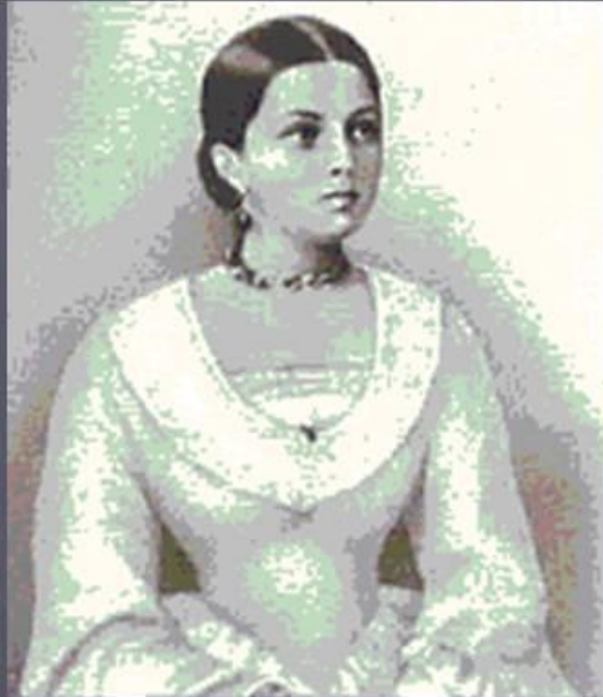
А. Я. Панаева

Драматичной была любовь поэта, связавшая его на долгие годы с Авдотьей Яковлевной Панаевой. Она была его счастьем и мукой, вызвала целую серию любовных стихотворений, известных под названием панаевского цикла. Влюблённые встречаются, ссорятся, мирятся, расстаются. И в этом «романе» утверждается идеал заботливой, ласковой женщины-подруги как опоры в трудной жизненной борьбе, как целительницы поэта, испытывающего творческие и сердечные муки. Стихотворение «Мы с тобой бестолковые люди..» посвящено Панаевой. Любовь в стихах Некрасова согревает человека, помогает выжить в жестоком мире.