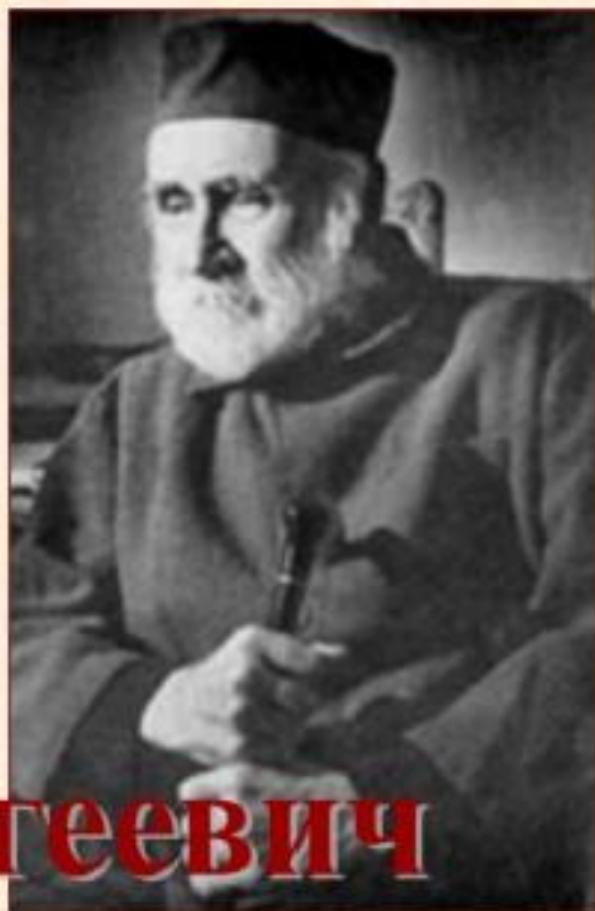
Иван Сергеевич Соколов-Микитов