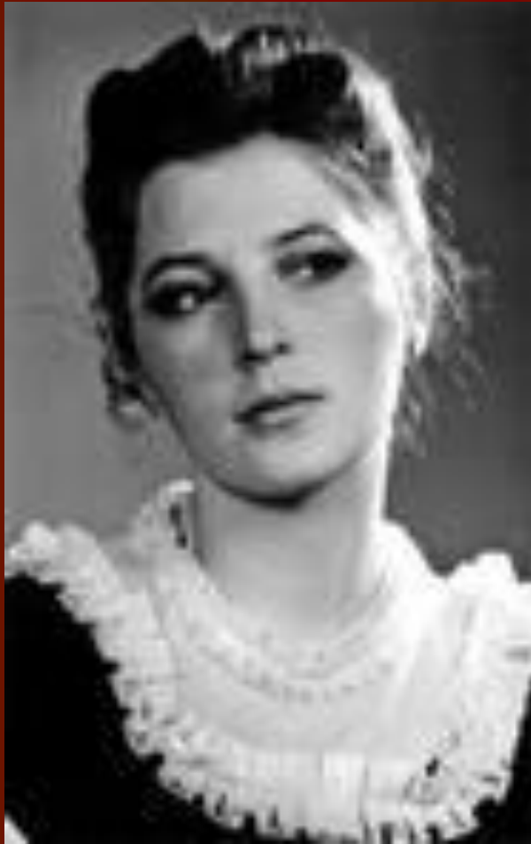
София Павловна (о Чацком)