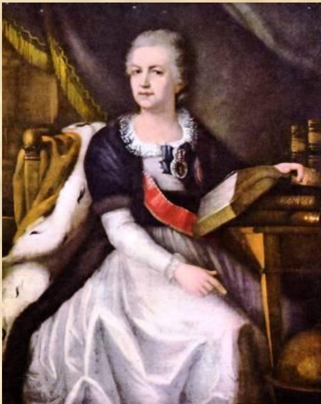
Неизвестный художник. Портрет Е.Р. Дашковой.