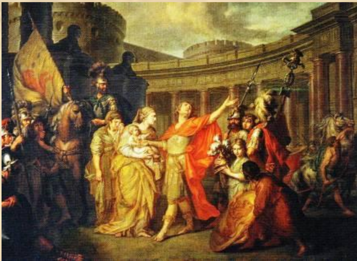
А.П.Лосенко. Прощание Гектора с Андромахой. 1773