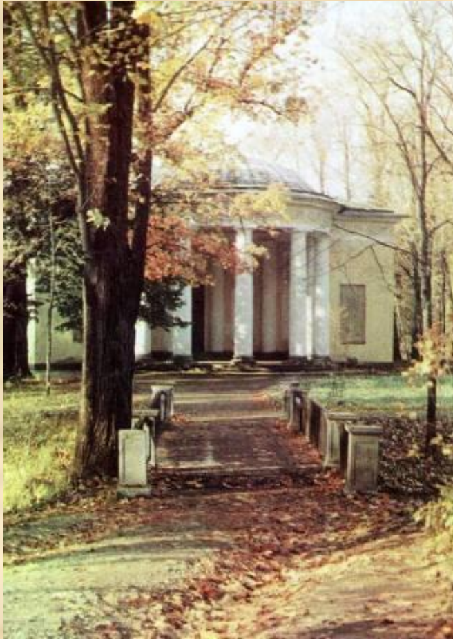
г.Пушкин. Павильон Концертный зал.