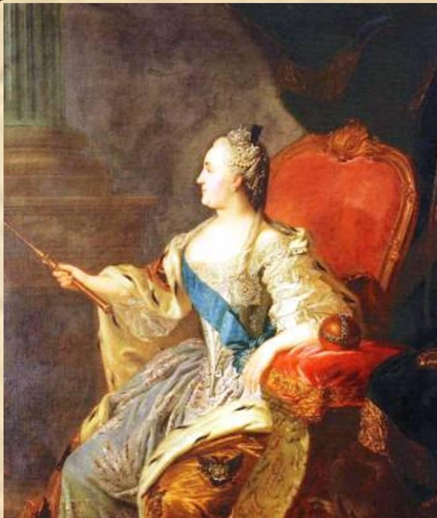
Ф.С.Рокотов. Портрет Екатерины II. 1763