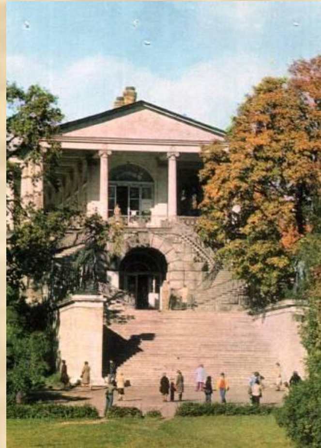
г.Пушкин. Камеронова галерея