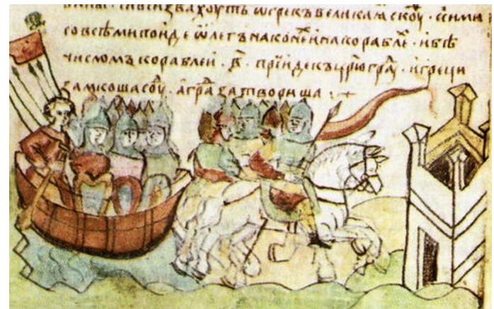
Поход на Царьград