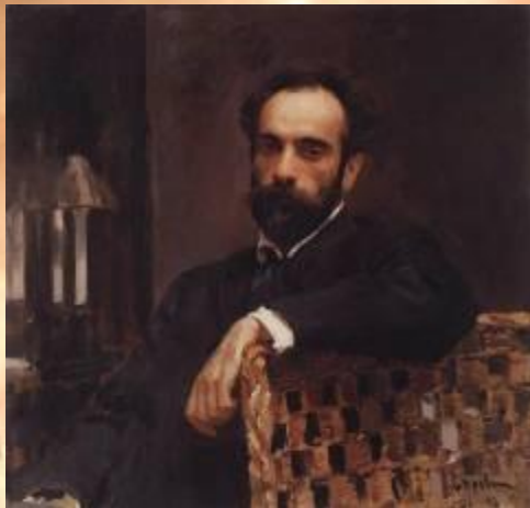
Исаак Ильич Левитан (1860-1900 г.г.)