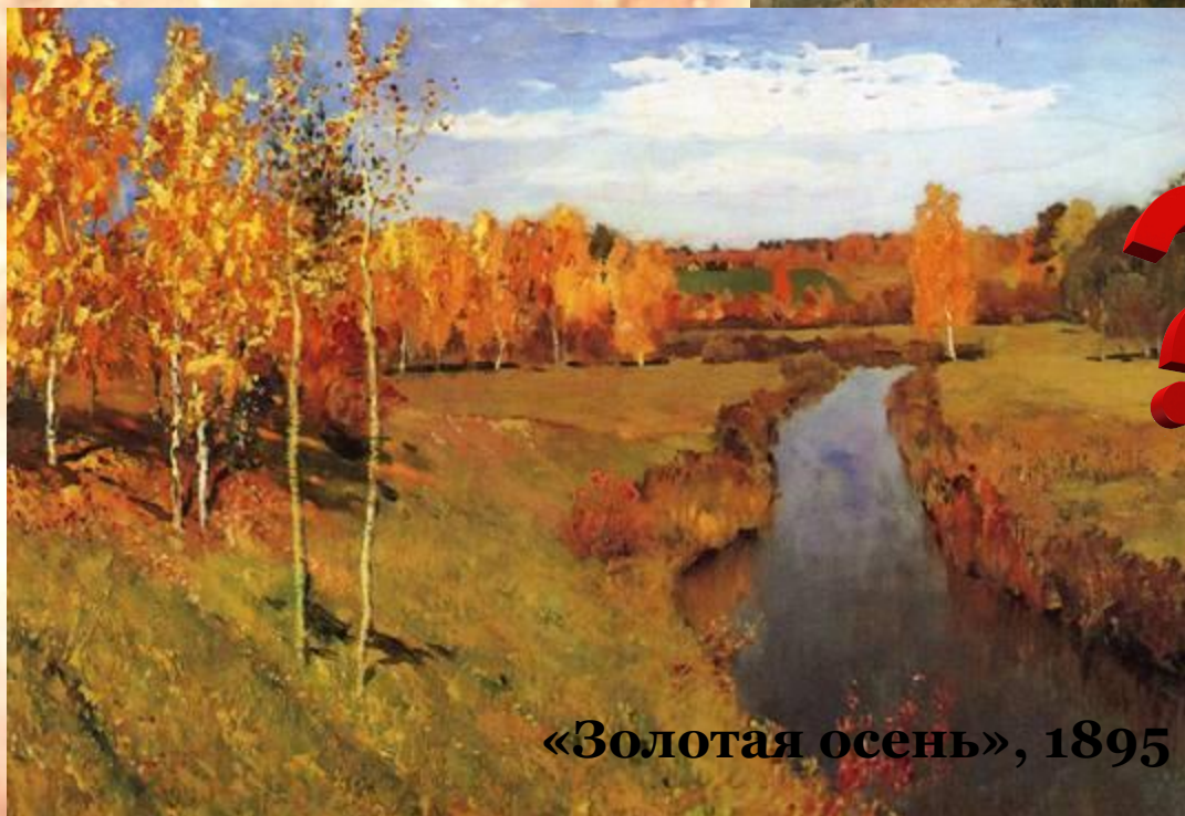
«Золотая осень», 1895