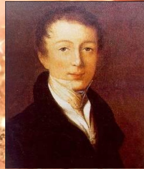
Федор Иванович Тютчев (1803-1873 г.г.)

Есть в осени первоначальной Короткая, но дивная пора - Весь день стоит как бы хрустальный, И лучезарны вечера... Пустеет воздух, птиц не слышно боле, Но далеко еще до первых зимних бурь И льется чистая и теплая лазурь На отдыхающее поле...