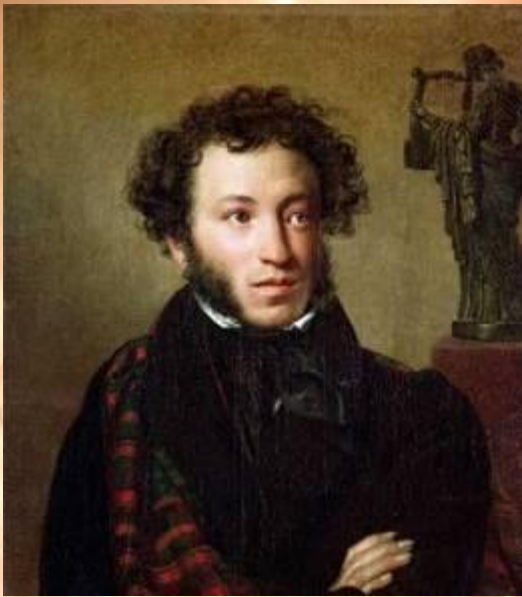
Александр Сергеевич Пушкин (1799-1837 г.г.)

Унылая пора! Очей очарованье! Приятна мне твоя прощальная краса - Люблю я пышное природы увяданье, В багрец и в золото одетые леса, В их сенях ветра шум и свежее дыханье, И мглой волнистою покрыты небеса, И редкий солнца луч, и первые морозы, И отдаленные седой зимы угрозы.