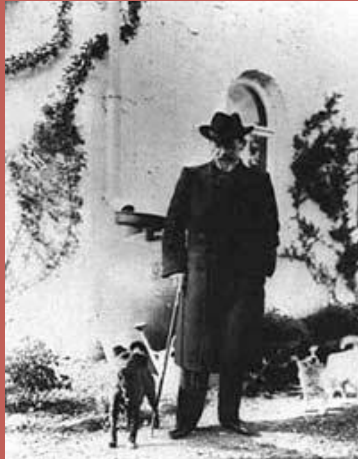
А.П. Чехов. Ялта. 1903 г.

( отражение реальности, жизненной правды)