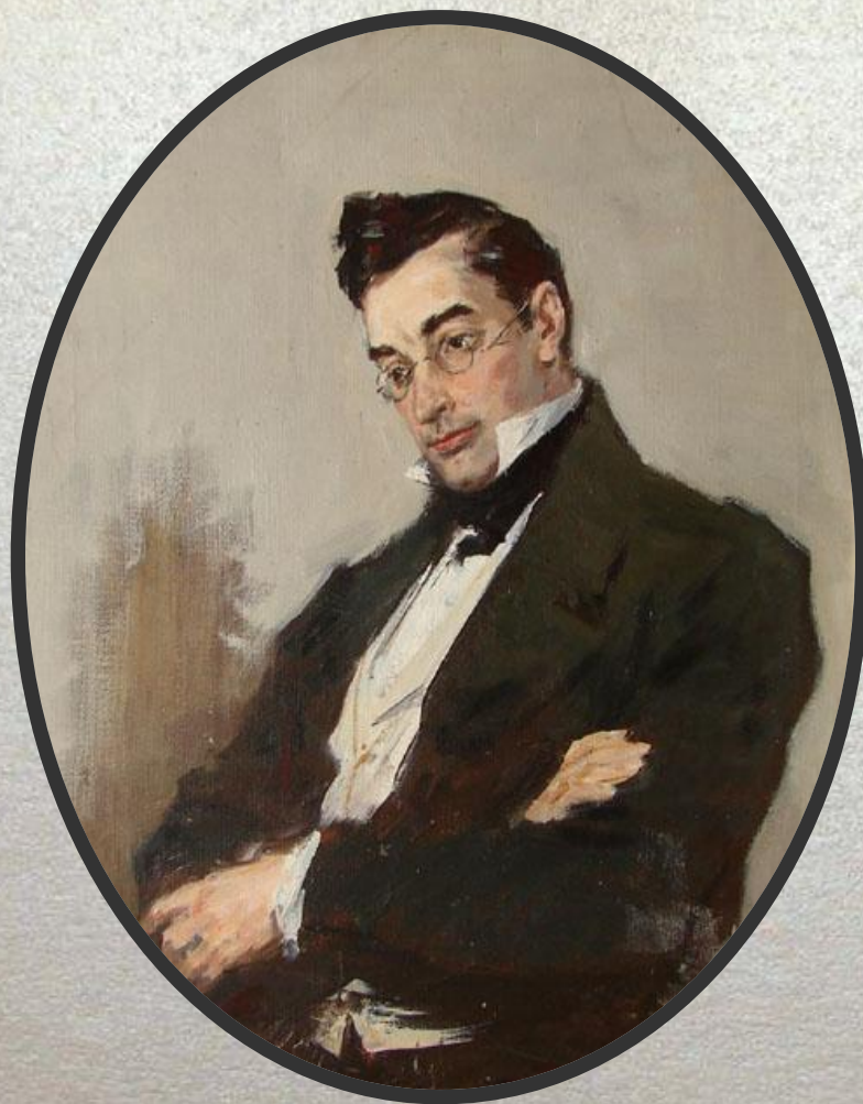
Александр Сергеевич Грибоедов