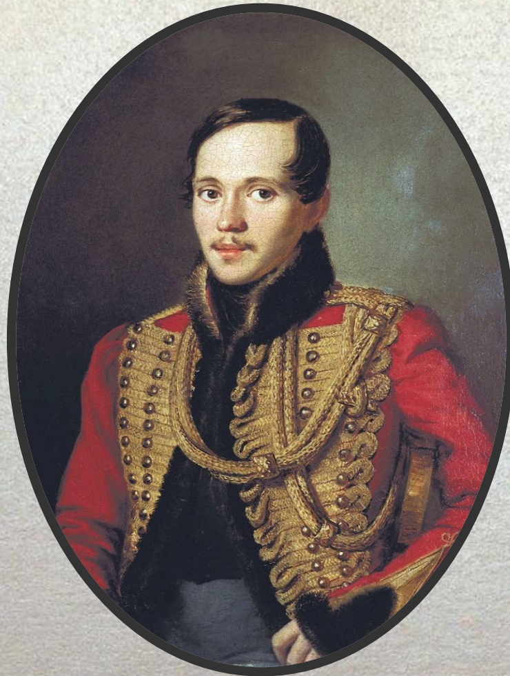
Василий Андреевич Жуковский