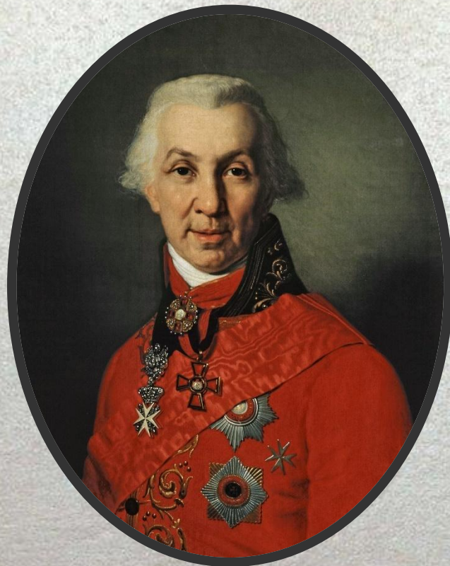
Державин Гавриил Романович

Одним из известных представителей классицизма является