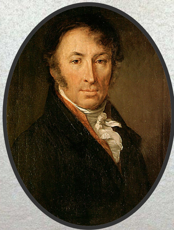
Николай Михайлович Карамзин