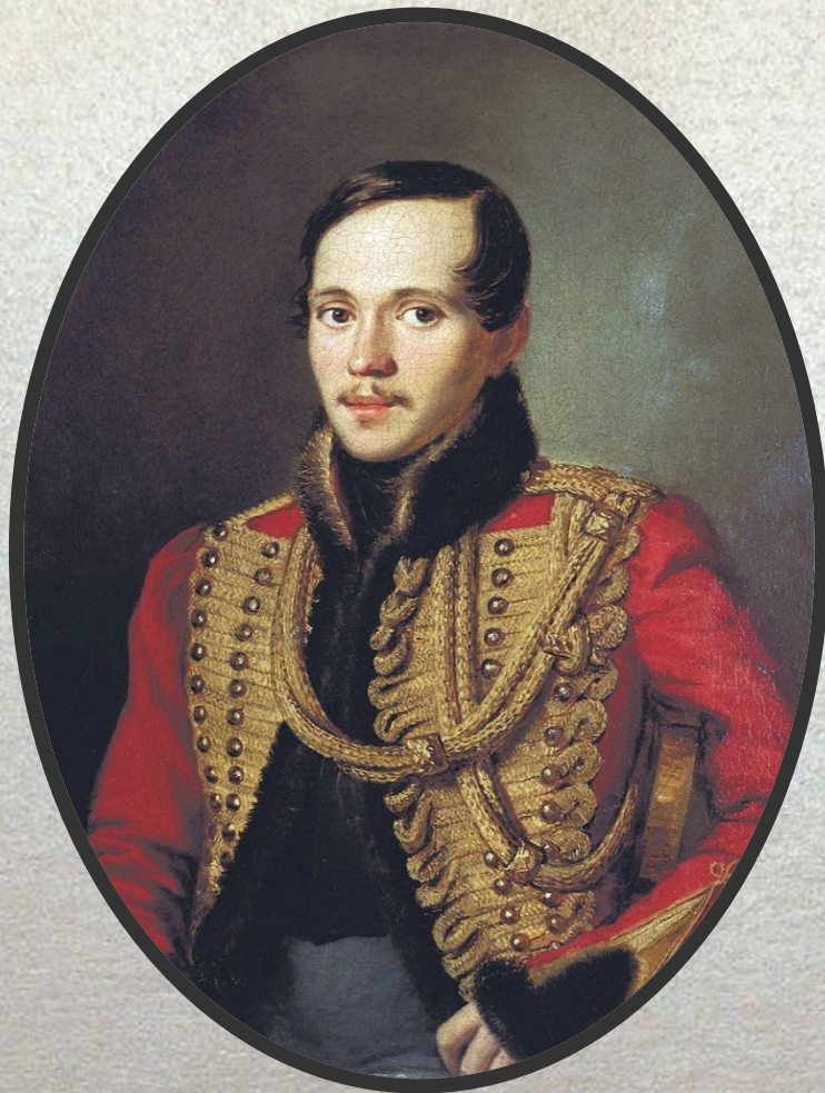
Василий Андреевич Жуковский