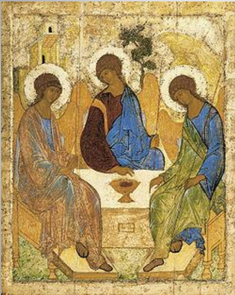
«Троица» Андрея Рублёва