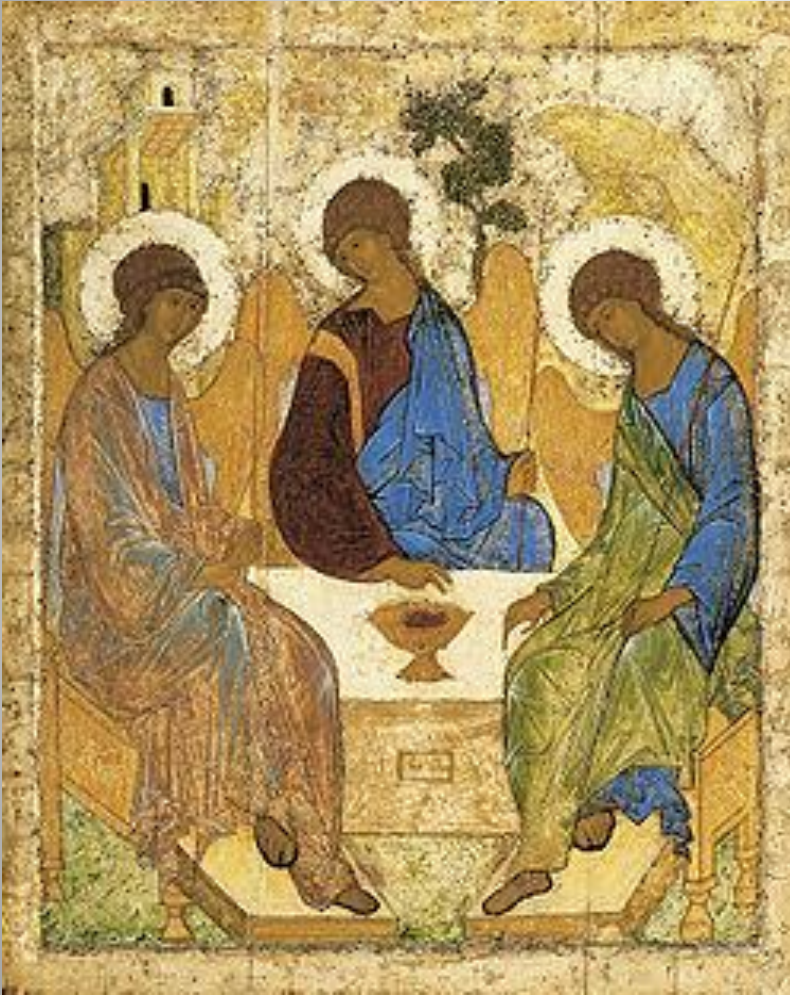
«Троица» Андрея Рублёва