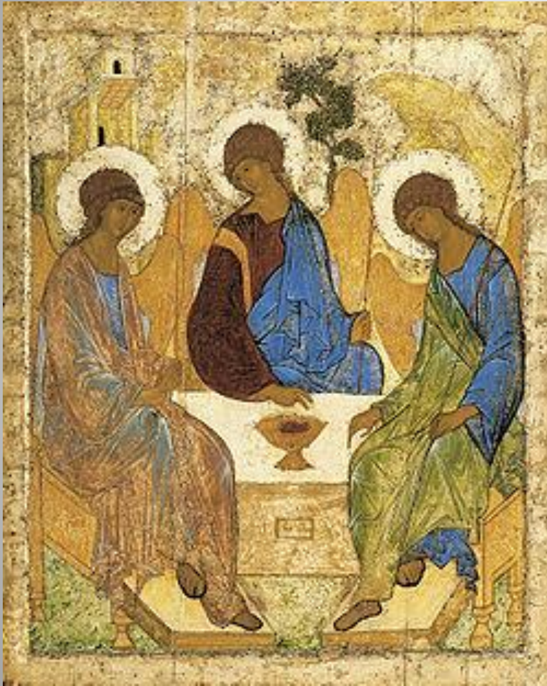
«Троица» Андрея Рублёва