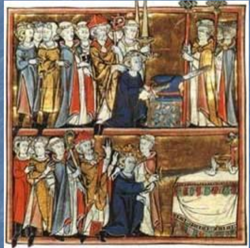
Роман «Артур и Мерлин» 13 в. Артур вытаскивает меч из камня