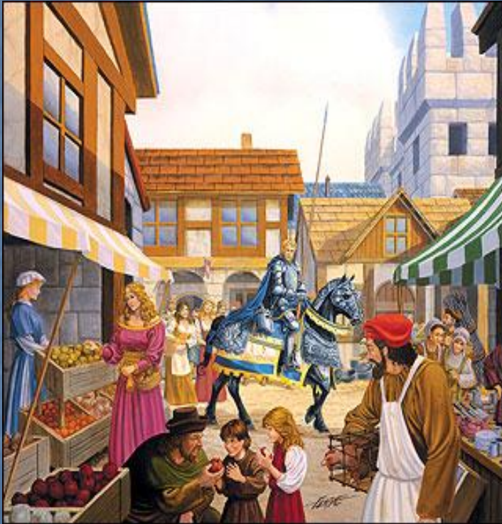
Улица средневекового города XII-XV вв.