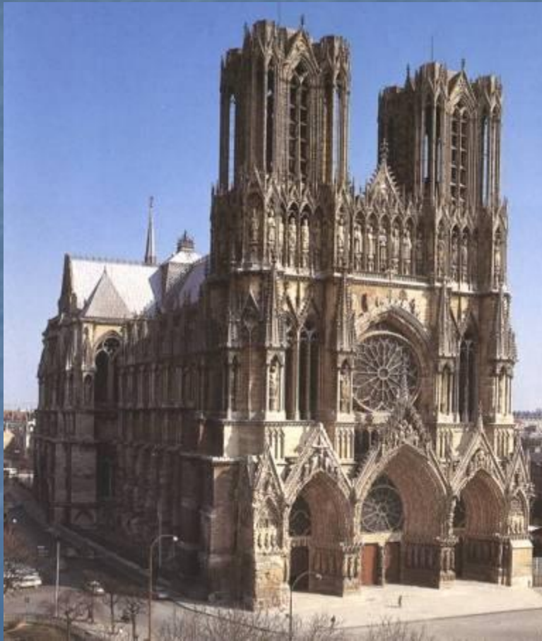
Реймский собор XIII-XV вв.

...Я кроток и смирен сердцем, и найдете покой душам вашим; ибо иго мое благо, и бремя мое легко. Библия новый завет. Евангелие от МАТФЕЯ.-Гл.11