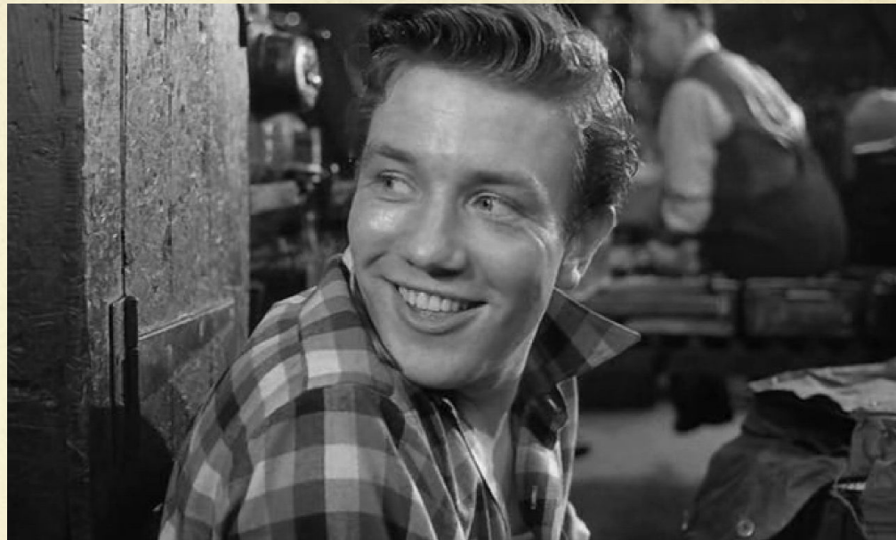
Кадр из к/ф «В субботу вечером и в воскресенье утром»

Произведения: «В субботу вечером и в воскресенье утром» (1958), «Ключ от двери» (1961) А. Силлитоу, «День сардины» С. Чаплина (1961)