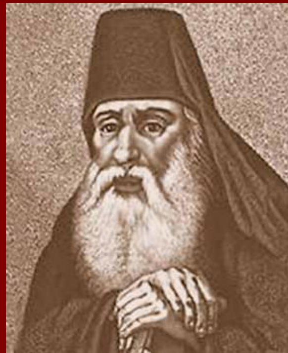
Симеон Полоцкий, гравюра XVII века