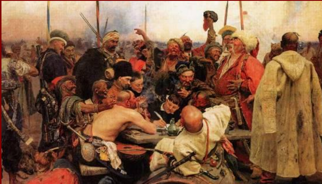
И.Е. Репин, картина "Запорожцы пишут письмо турецкому султану"