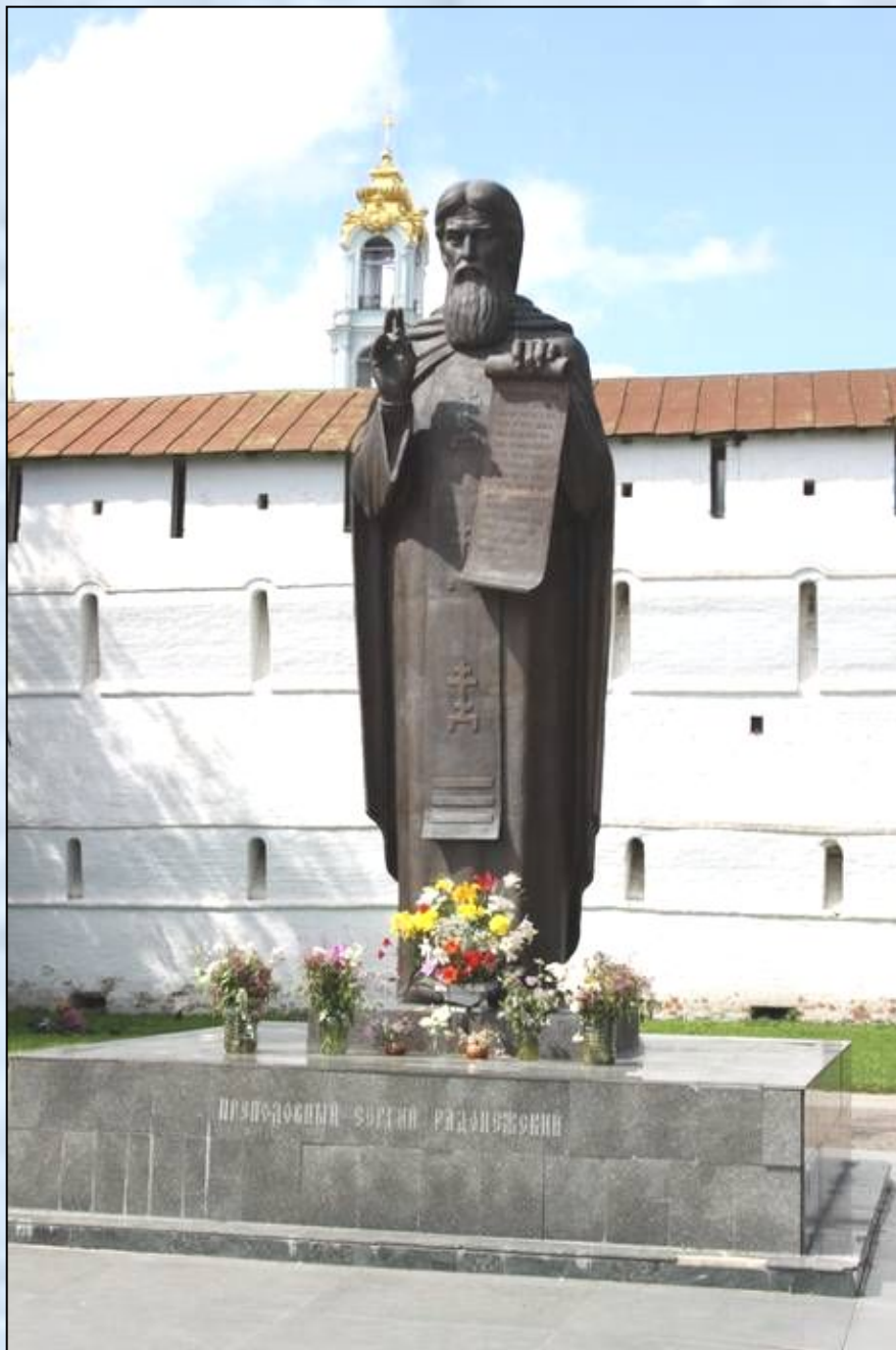
Памятник Сергию Радонежскому в Сергиевом Посаде