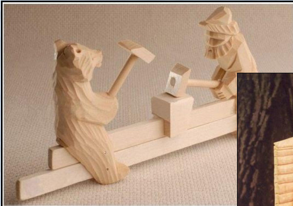
Богородская игрушка "Кузнецы".

Легенда о том, как зародился промысел Богородской игрушки, рассказывает, что первую деревянную игрушку сделал сам Преподобный Сергей. Будто бы он в свободное от молитв и трудов время вырезал из липы птичек, коньков и дарил "на благословенье" детям.