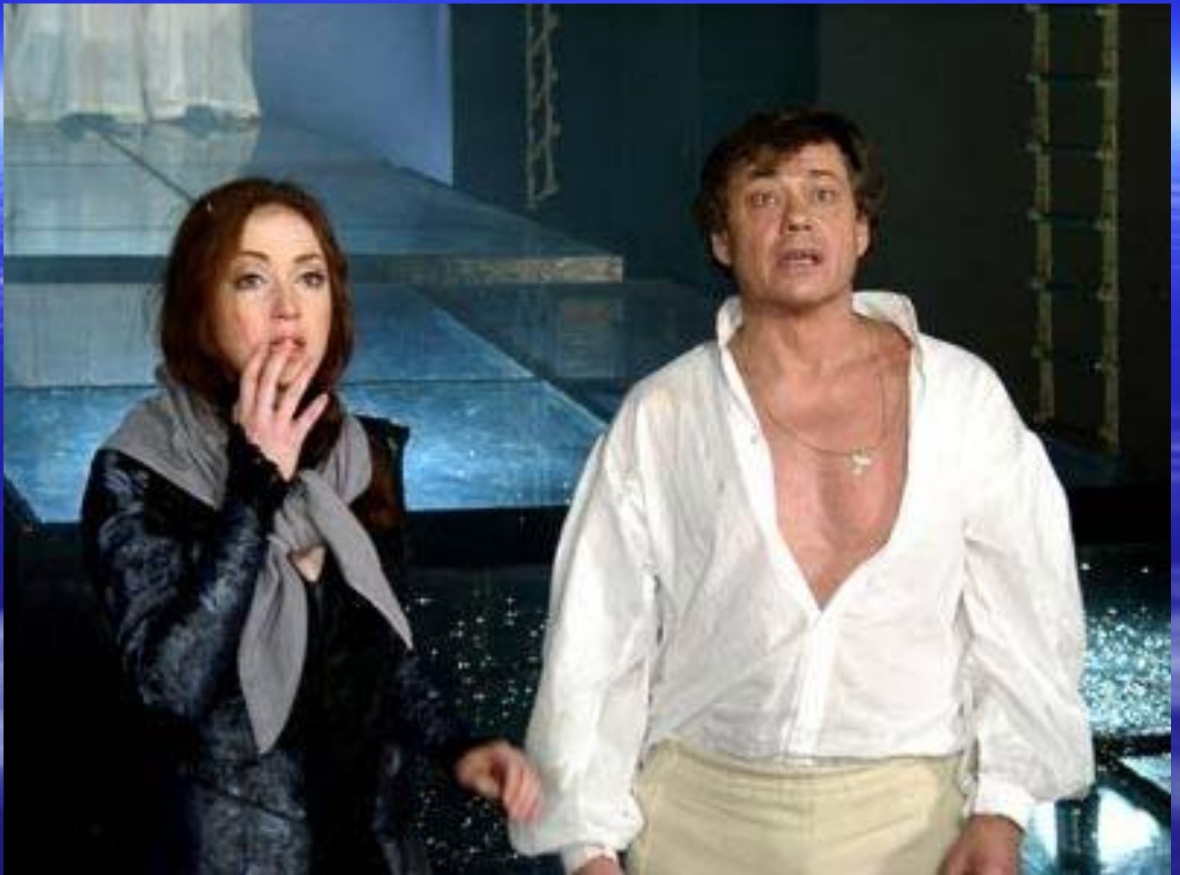
Сцена из рок-оперы «Юнона и Авось»