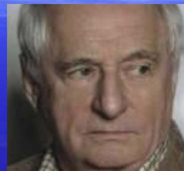
Марк Захаров 1981г. поставил рок- оперу «Юнона и Авось» в театре Ленком.