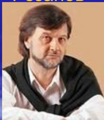
Алексей Рыбников композитор музыки к рок- опере «Юнона и Авось».