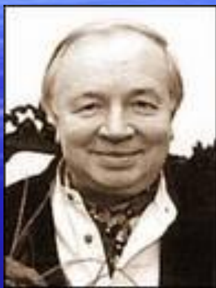
Андрей Вознесенский 1970г. написал поэму «Авось». 1977- текст оперы «Юнона и Авось»