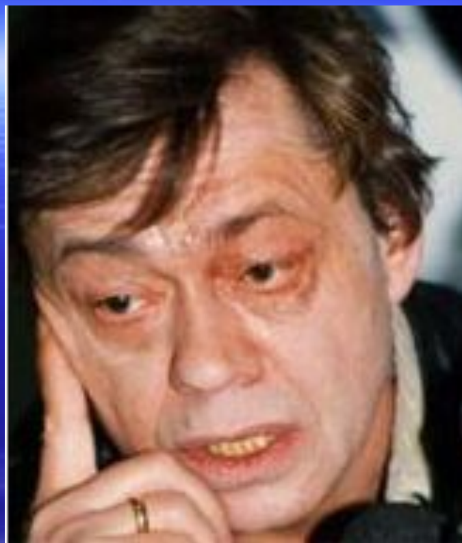
Николай Петрович Караченцов 20 век