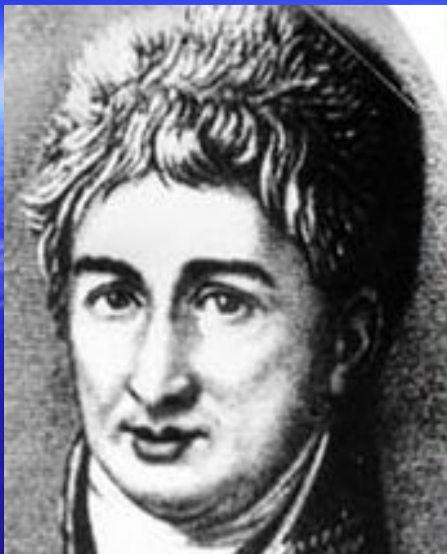
Николай Петрович Резанов 18 век