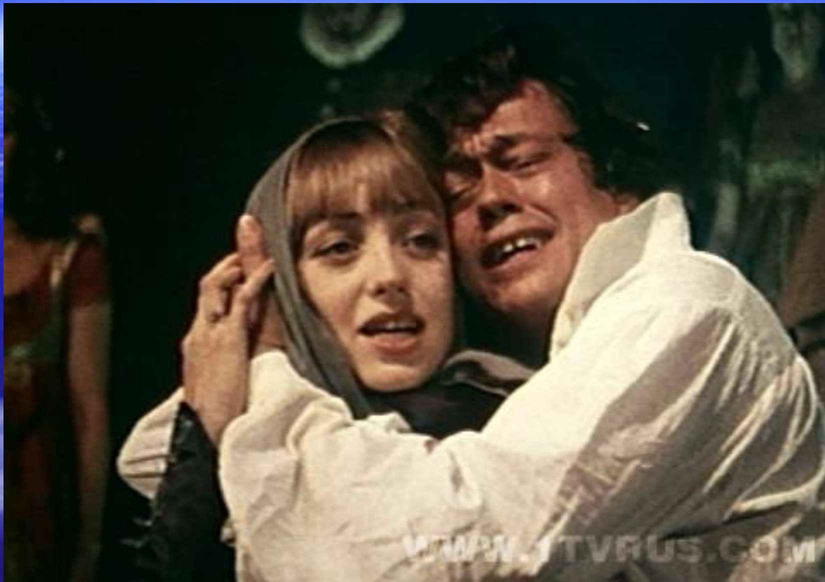
Сцена из рок-оперы «Юнона и Авось»