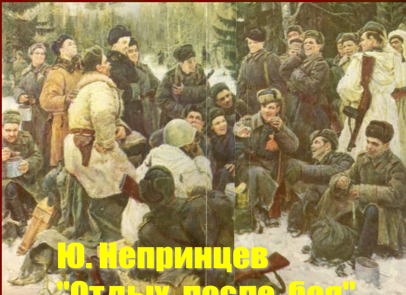
Ю. Непринцев "Отдых после боя"